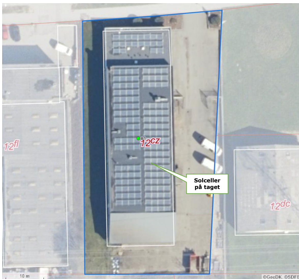
Luftfoto af virksomheden med matrikelskel

I forhold til kommuneplanen ligger virksomheden i erhvervsområde 240102ER. Områdets anvendelse er fastlagt til erhvervsformål, men der er etableret enkelte boliger i området.