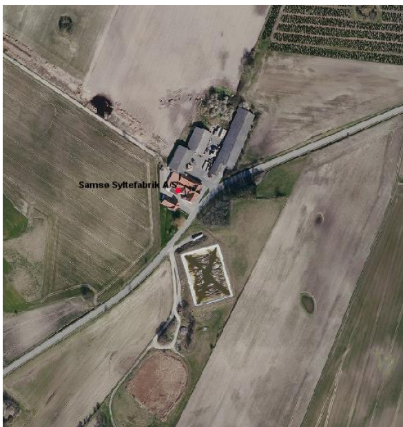
Kort over Samsø Syltefabrik

Virksomheden er beliggende i landzone, 350 meter vest for Permelille.