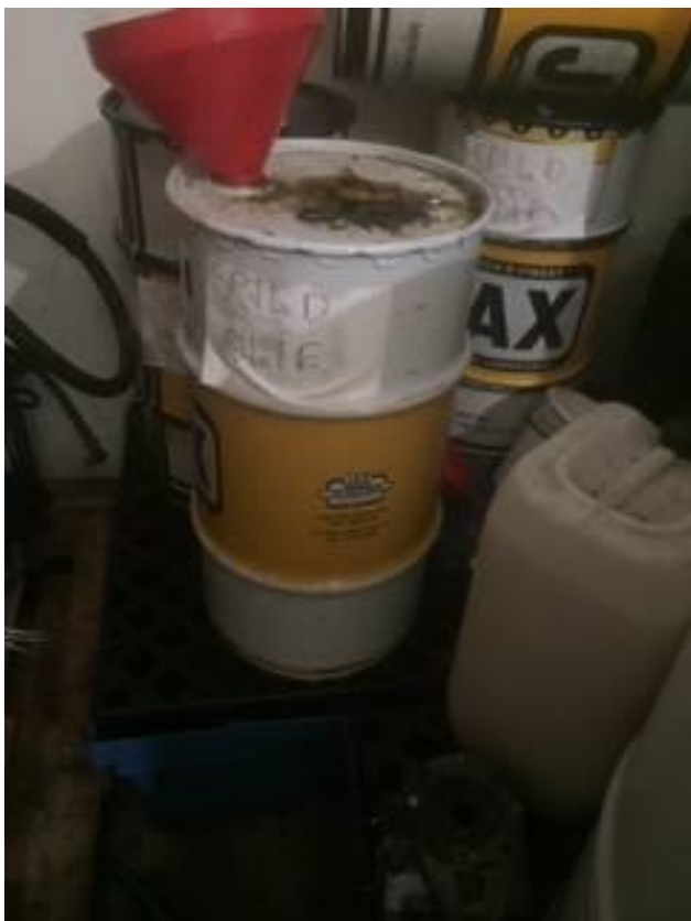
Flydende farligt affald og råvarer opbevares i værksted. Der anskaffes opsamlingsbakke