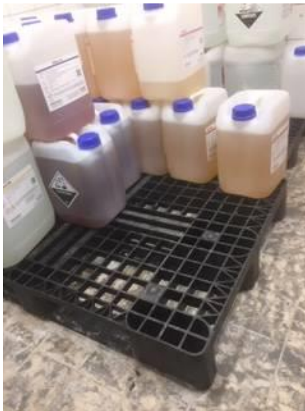
Kemi står på tæt guld uden afløb.