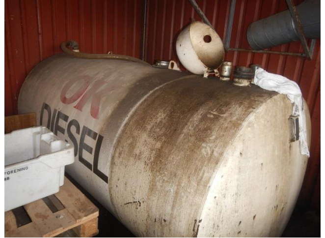
2. Tankgård med opkant, under tag. Spildolietank /olie-vand