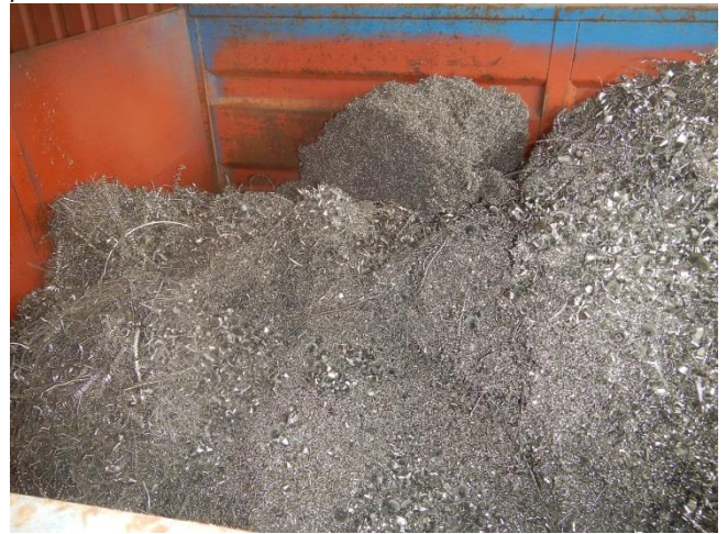
4. I oplagsplads under tag. Container med spåner.