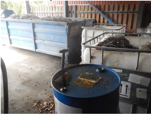
3. Oplagsplads under tag. Oliespild evt. dryp fra spåner løber til opsamlingsbrønd Foran. 200 l tromle til spildolie. Bagved: container med spåner