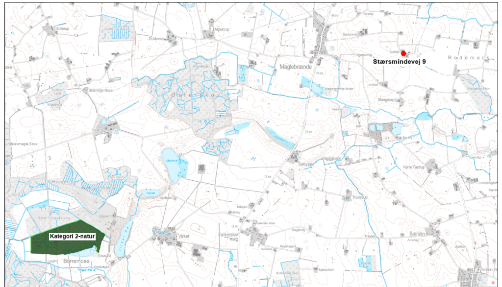
Kort 2. Beliggenheden af husdyrbruget i forhold til nærmeste kategori 2-natur.