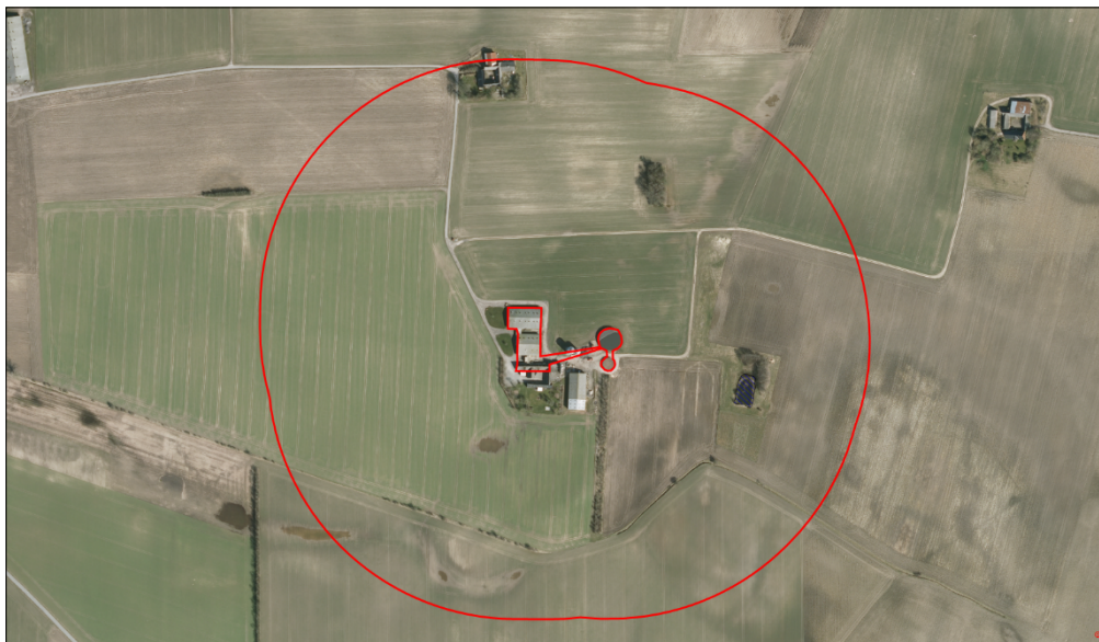
Kort 4. Beliggenheden af det beskyttede vandhul (blå skraveret signatur) ved husdyrbruget. Den ydre røde streg angiver afstanden på 300 m fra stalde og gødningslagre.