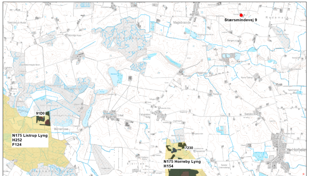
Kort 1. Beliggenheden af husdyrbruget i forhold til nærmeste kategori 1-natur Natura 2000-område 175.

De anbefalede tålegrenser for naturtyperne er (jf. Notat fra DCE af 6-9-2018):