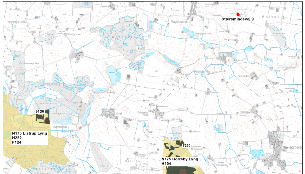
Kort 2. Beliggenheden af husdyrbruget i forhold til nærmeste kategori 1-natur Natura 2000-område 175.