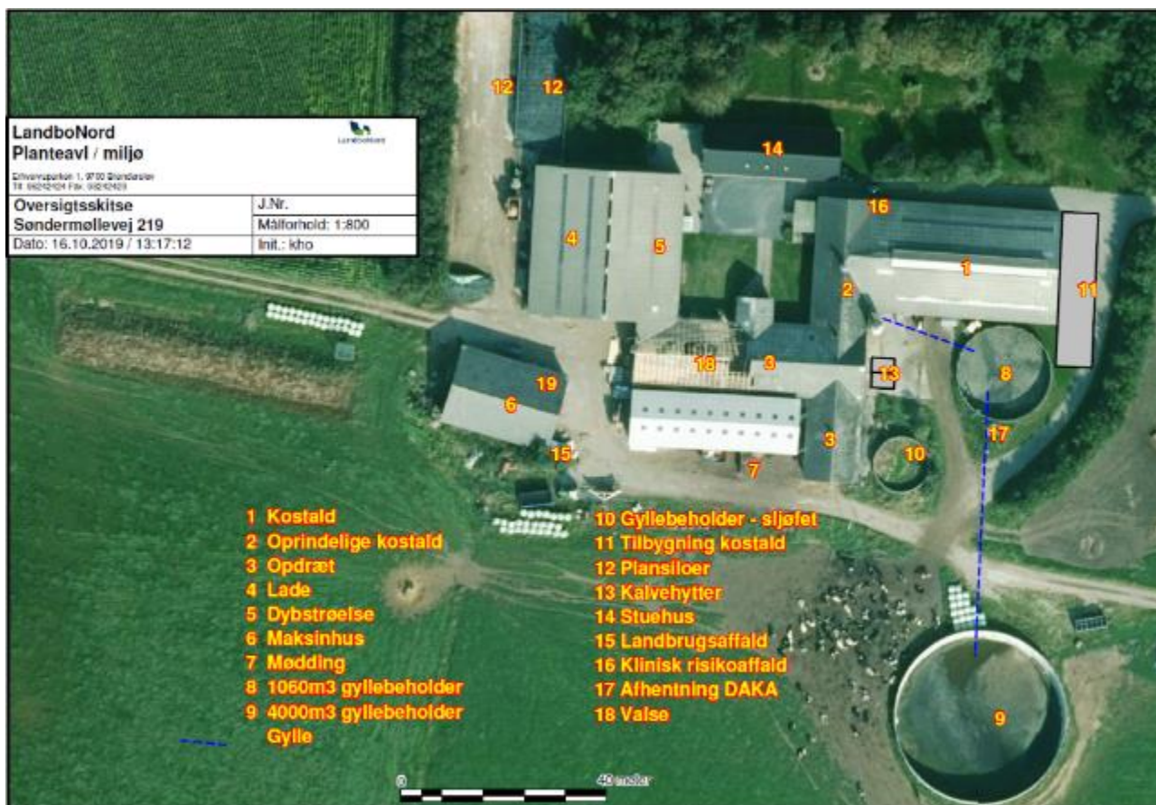
Figur 1: Anlægstegning