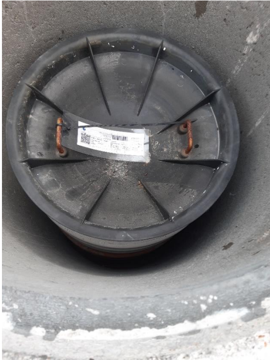
Foto 3. mærkning af brønd.