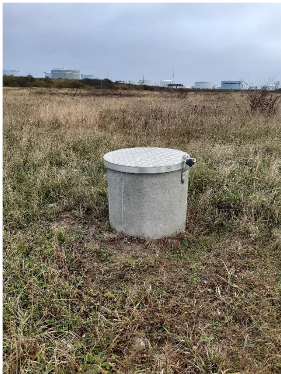
Foto 2. Monitoringsbrønd nr. 2.

Alle brønde var korrekt hævet over terræn, aflåste og korrekt mærket. Ingen bemærkninger.