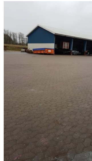
Oplag af brugt blæsemiddel