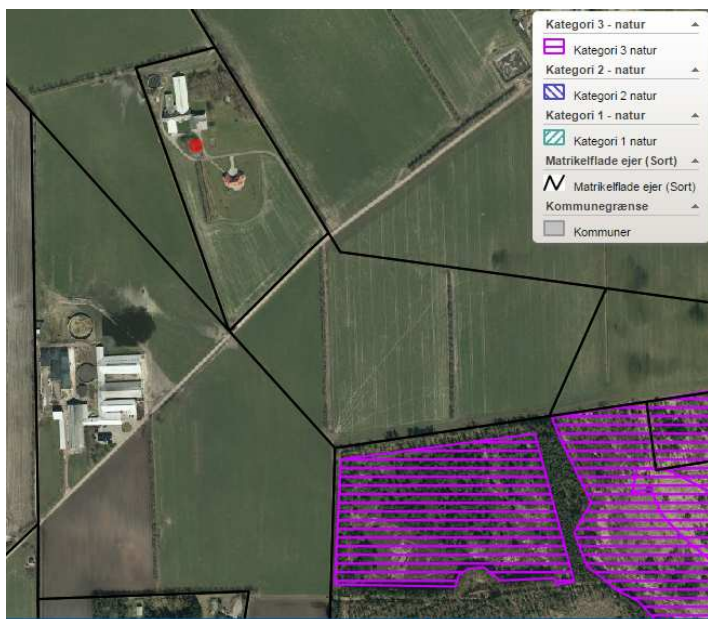
Figur 3: Der er ingen kategori 1, 2 eller 3 natur i umiddelbar nærhed af hverken udsprinklingsområdet eller omkring plansiloanlægget.