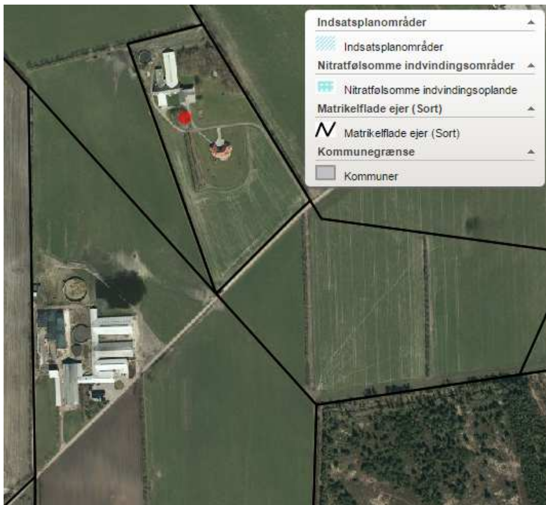
Figur 2: Der er ingen NFI eller indsatsplanområder i hverken udsprinklingsområdet eller omkring plansiloanlægget.