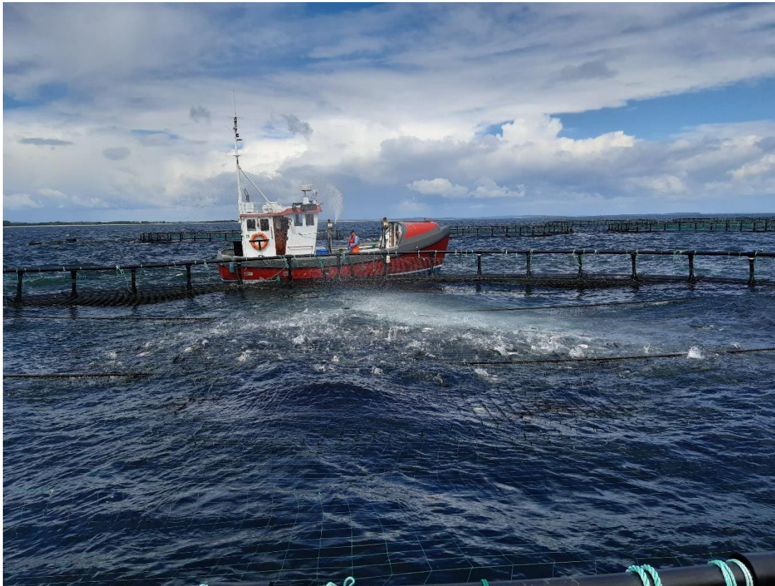
Figur 2: Fodring af fisk med foderkanon

Årø Havbrug har 12 bure med en diameter på 80 meter. Burene er placeret i tre rækker ad fire bure hver. Der er udsat 36.000 kg regnbueørred ( O. mykiss ) i de første 11 bure og omkring 33.500 kg i det sidste bur, hvilket svarer til 403.050 fisk med en gennemsnitsvægt på 1083 g.