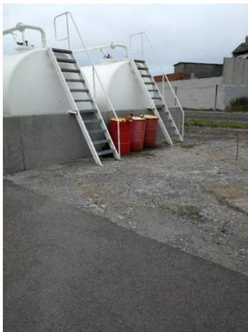
Tønder for enden af tankgården i 2021

Ved tankgården stod der ved tilsynet i 2021 3 tønder, hvor den ene var med tragt. Det blev oplyst, at spild fra tankning bliver opsamlet på en bakke, og at indholdet efterfølgende bliver påfyldt tøndene. Der var risiko for at tøndene kan vælte og at indholdet derved løber ud.