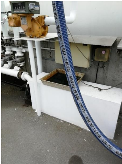
"spildbakke" ved tankgården.

Der er fornuftigt at opsamle spild fra tankningen, men bakken til formålet skal opbevares så der ikke er risiko for at indholdet tømmes uhensigtsmæssigt. På tilsynet i 2022 kunne det konstateres, at forholdet var bragt i orden.