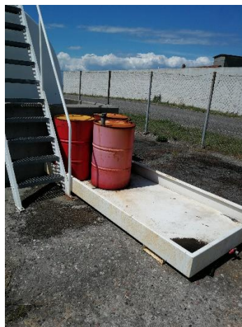
Tønder placeret i spildebakke i 2022

På tilsynet i 2022 kunne det konstateres at tønderne var placeret i spildebakke. Det blev oplyst at regnvand blev fjernet dagligt ved regnvejlr.