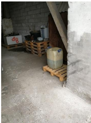
Opskåret dunk med olieaffald

Dette kunne på nuværende tilsyn konstateres at være bragt i orden.