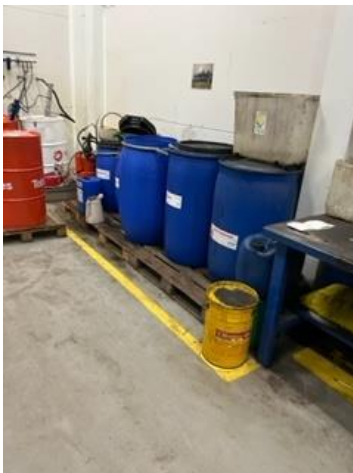
Affaldsopbevaring af oliefiltere, køler væske, bremsevæske, vand fra bremserenser