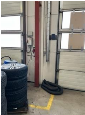
Udsugning til påsætning på udstødning