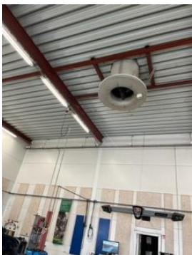
Afkast i loftet