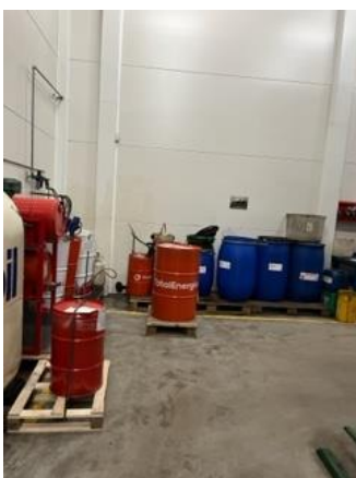
Spildolietank, forrest til venstre i billedet. Opbevares i rum uden afløb