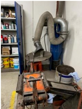
Udsugning ved slibemaskine til slibning af dæk