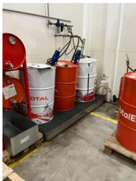
Opbevaring af olieprodukter