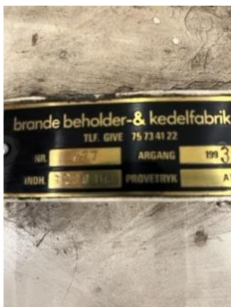
Mærkning på spildolietank