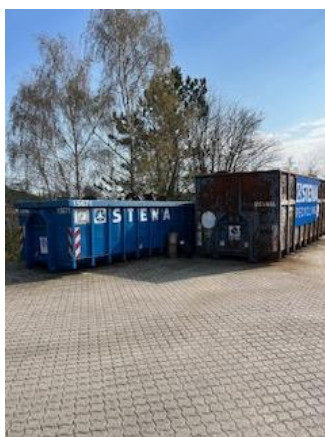
Figur 1. Til venstre container med metalaffald stod udendørs i åben container.