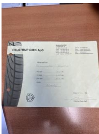
kvittering for modtagelse af dæk til affald. Helstrup formidler kontakten mellem EUROMASTER og Genan, som modtager dæk