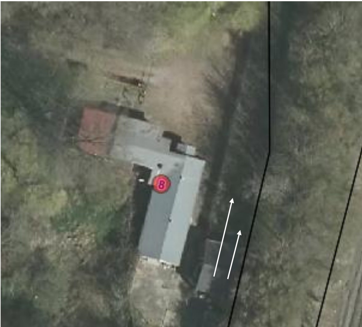
Luftfoto af skydebanen med bygninger og matrikelskel

Skydebanen er beliggende inderst i vinklen mellem de nord- og sydgående jernbanelinjer fra Aarhus Hovedbanegård i område 12.00.03.NA, som er udlagt til naturformål. Nærmeste støjfølsomme område er etageboliger knap 200 m mod SØ og kolonihaver ca. 325 m mod NV.