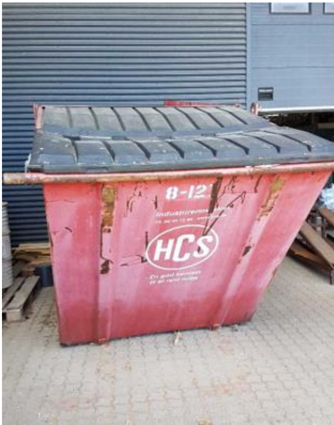
Container til brændbart erhvervsaffald.