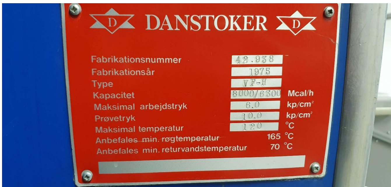
Kedel 1 (8000 Mcal/h = 9,3 MW)