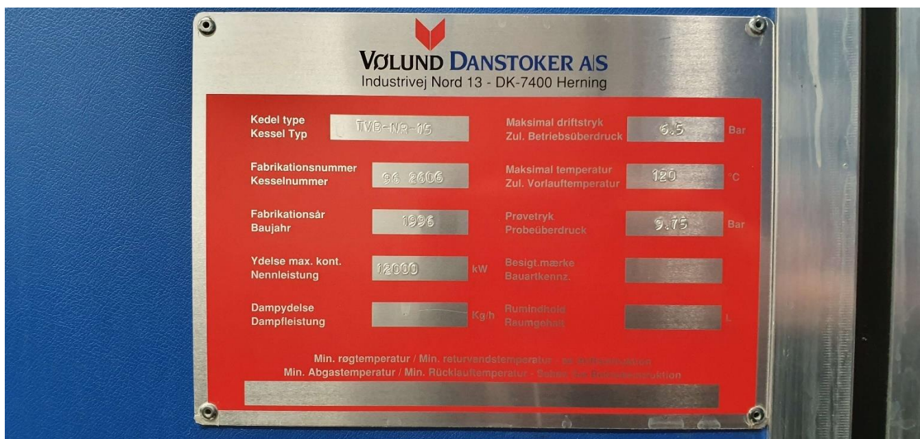
Kedel 3 (12 MW)