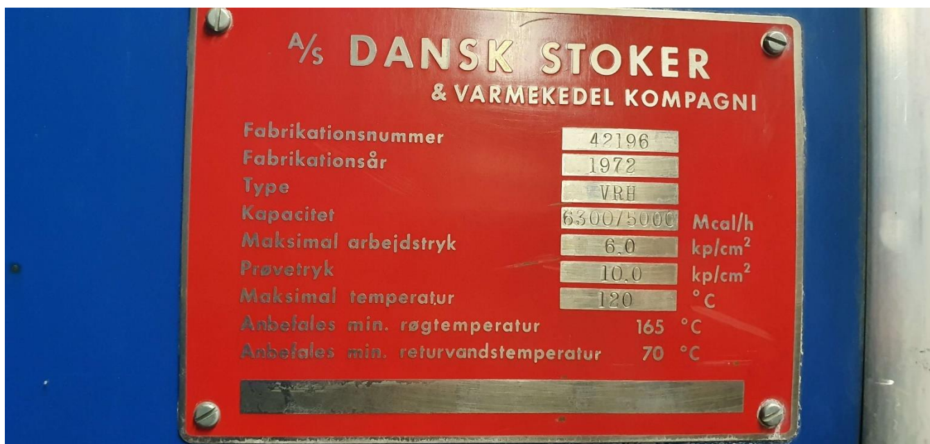
Kedel 2 (6300 Mcal/h = 7,3 MW)