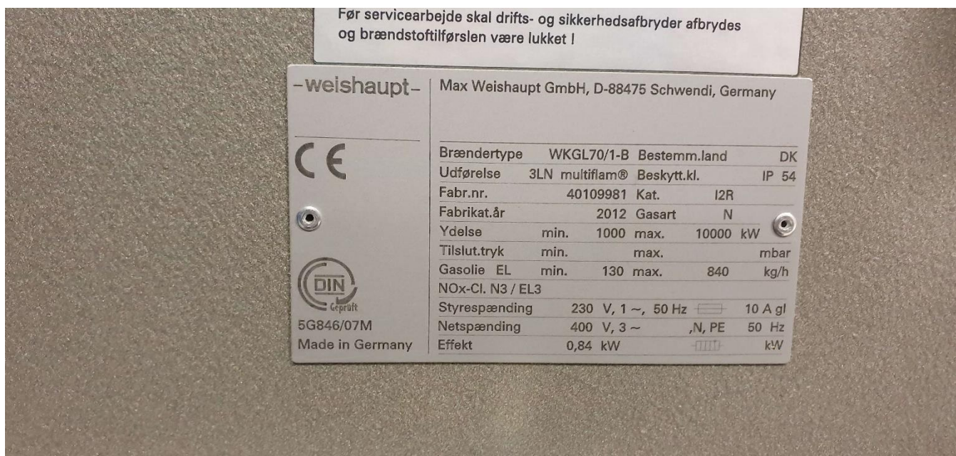
Brænder 2 (10 MW)