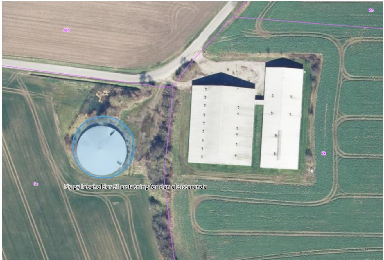
Figur 1. Placering af ny gyllebeholder i forhold til ejendommen.

Gyllebeholderen vurderes til at blive opført i tilknytning til staldanlægget jf. nedenstående kort.