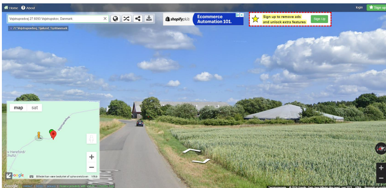
Figur 2. Skærmprent fra ansøgningen, som viser teltoverdækning af den eksisterende gyllebeholder.

Gyllebeholderens teltoverdækning forventes at komme op i ca. 8,7 meters højde (gyllebeholder med radius på 16,9 m, teltduk med 20 graders hældning og sider maks. 2,5 m over terræn). Den eksisterende gyllebeholder havde også grå teltoverdækning, og den nye gyllebeholder vil kun blive marginalt højere som følge af en lidt større diameter af gyllebeholderen. Det vurderes, at den nye gyllebeholder og staldanlægget på Vejstruprødvej 27 vil blive opfattet som et samlet anlæg, og at der derfor ikke er behov for vilkår om yderligere beplantning. Se skærmdump fra instantstreetview herunder.