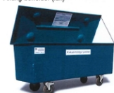
Aflang beholder (lån)