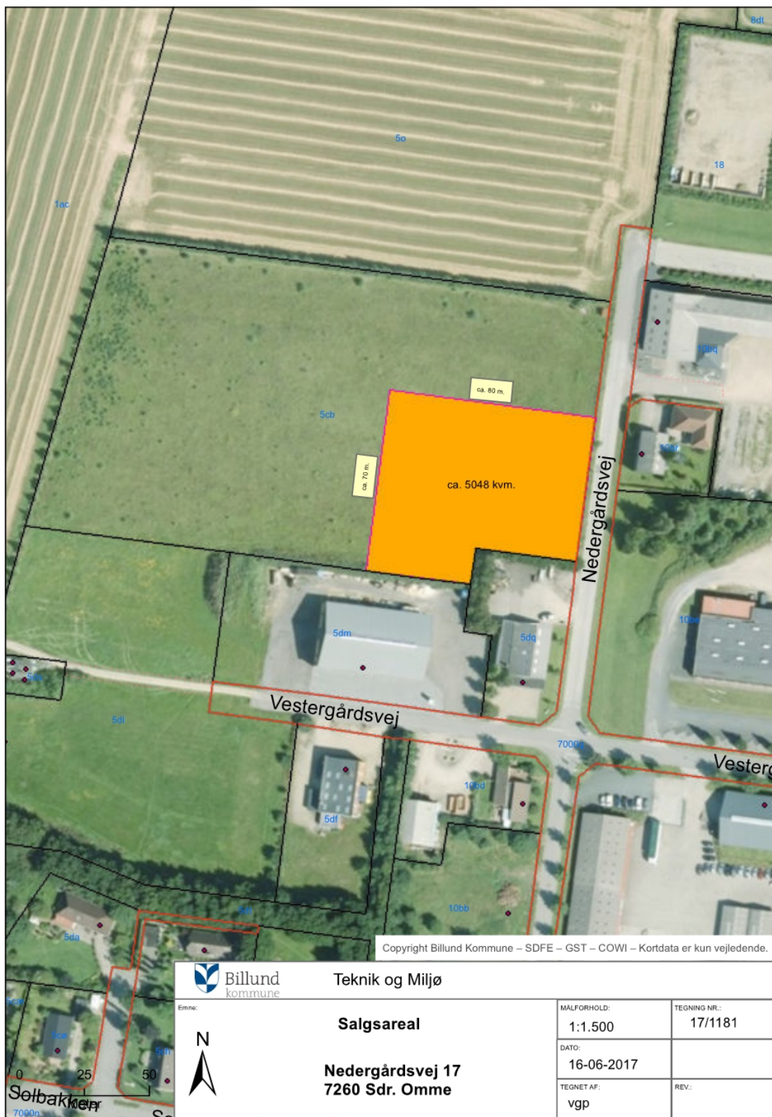
Figur 2: Placering af pladsen, målestok er ikke gældende.