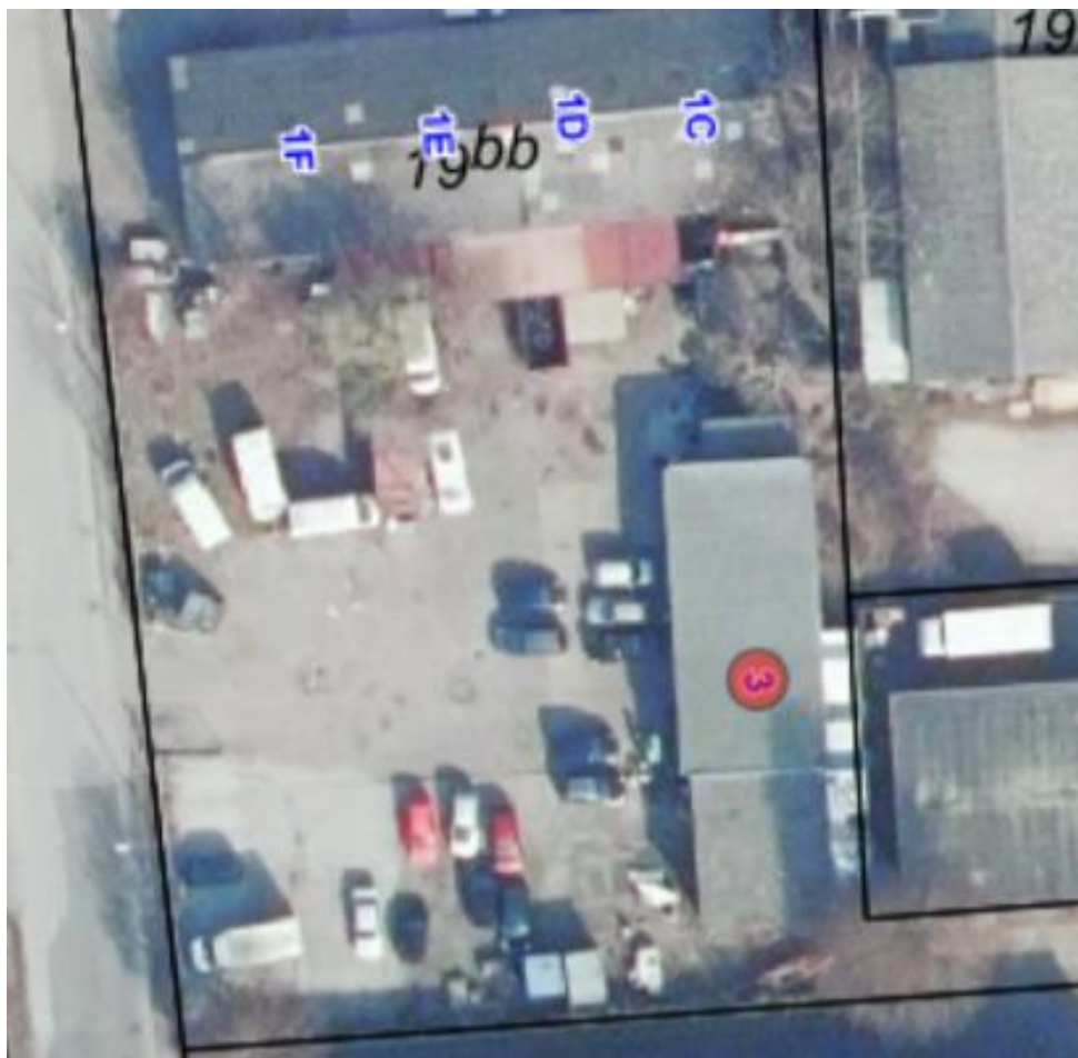
Luftfoto af virksomheden med matrikelskel anno 2022

I forhold til kommuneplanen ligger virksomheden i erhvervsområde 160513ER. Der ligger enkelte boliger i området, og virksomheden ligger mindre end 100 meter fra nærmeste bolig. Udendørs areal deles med lejere af Elkjærvej 1C, 1D, 1E og 1F, der indgår i samme matrikel.