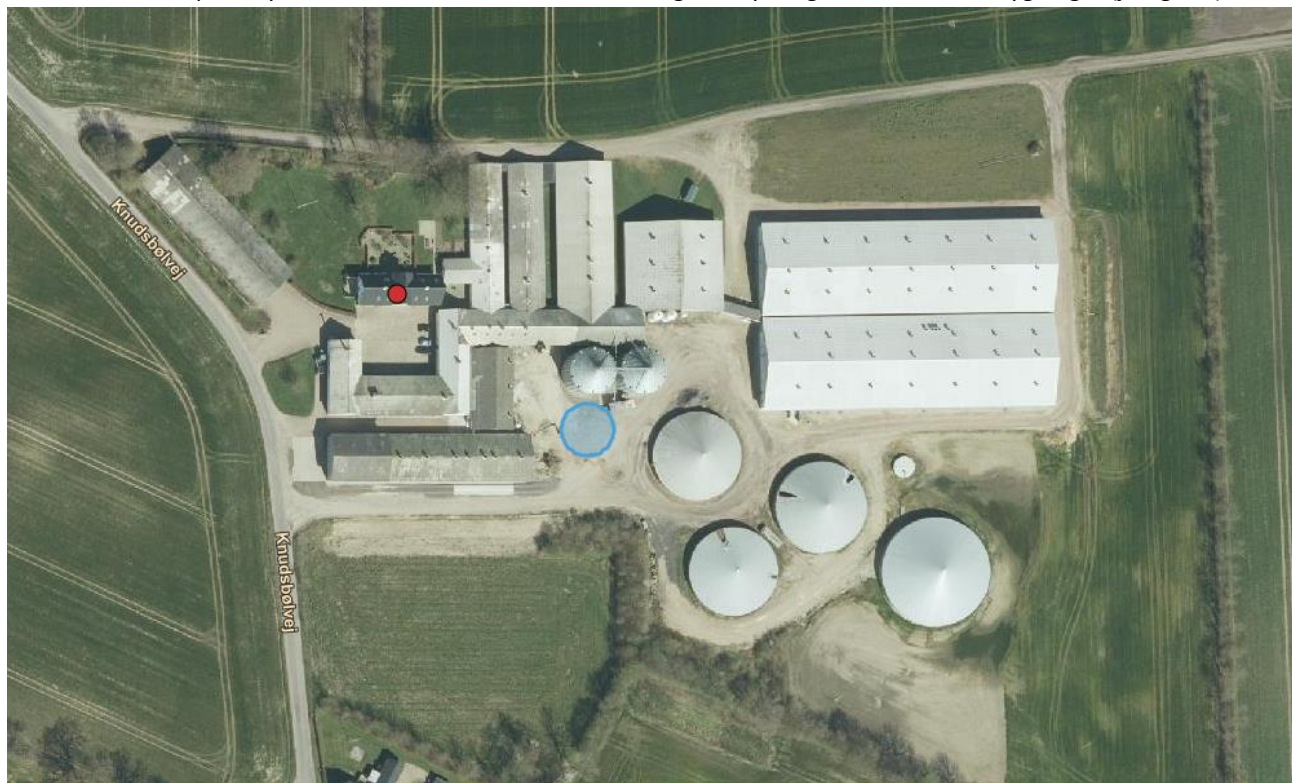
Figur 1. Oversigtskort over Knudsbølvej 36 med placering af den nye kornsilo (blå ring).

Kornsiloen af mærket Almas har en kapacitet på 1.300 tons korn. Siloen bliver med en diameter på 16,5 meter og en højde på 14 meter. Kornsiloen opføres i samme materialer (galvaniseret stål) som de to eksisterende kornsiloer. Siloerne ønskes opført syd for de to eksisterende kornsiloer og i tilknytning til eksisterende bygninger (jf. figur 1).