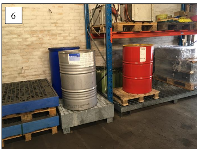
Foto 5 af opbevaring af olier på vogn med opsamlingskar og foto 6 råvarer på opsamlingskar.

Udendørsarealet er belagt med asfalt. Virksomheden er etableret på betongulv i produktionshallen.