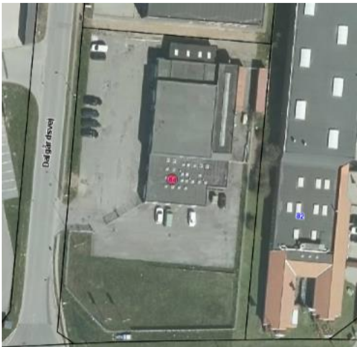
Luftfoto af virksomheden med matrikelskel, anno 2019

I forhold til kommuneplanen ligger virksomheden i område 240201ER, der er udlagt til erhverv. Der er enkelte boliger i området, og nærmeste bolig ligger i en afstand af ca. 50 meter.