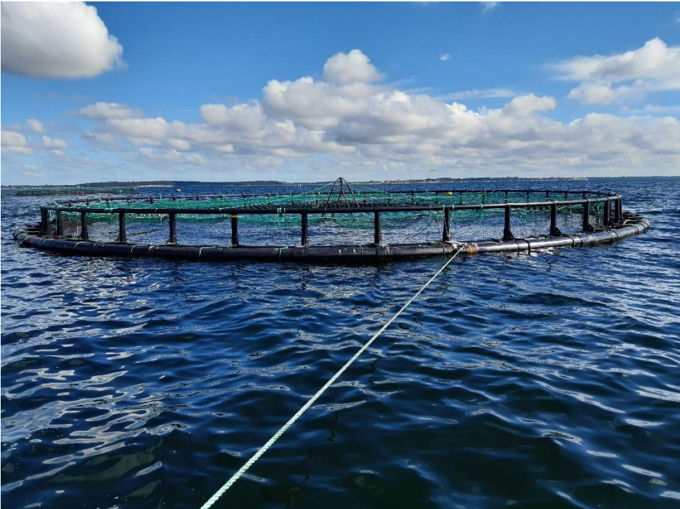
Karrebæk sydøstligt bur