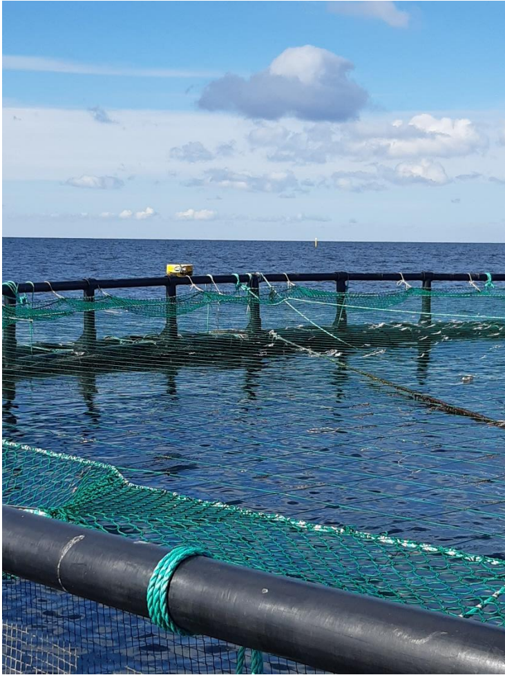
Karrebæk sydvestligt bur