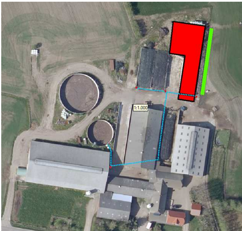
Kort 2: Plantegning. Røde punkter er pumpebrønde, blå linjer er pumpeledninger og fed grøn streg er beplantning.