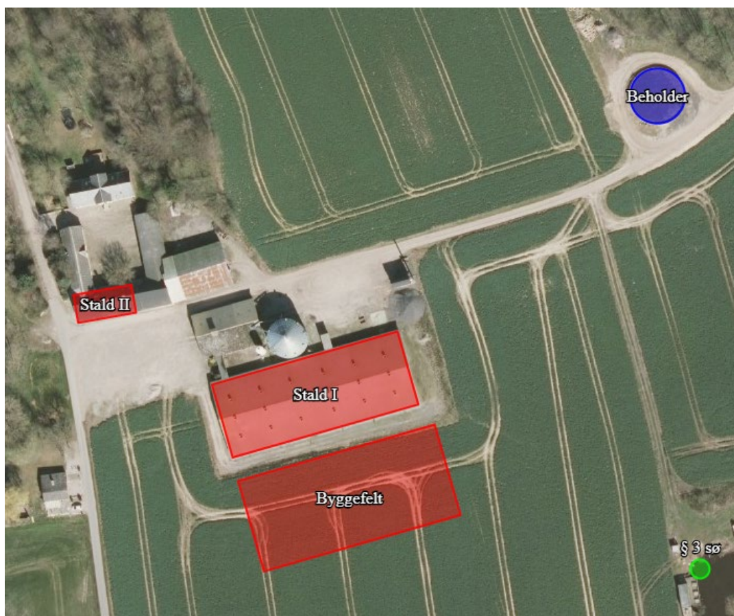
Figur 1: Oversigt over produktionsarealer på Hesselbjergvej 18, 5620 Glamsbjerg.

En oversigt over størrelsen på de enkelte produktionsarealer findes i ansøgnings-skemaet (nr. 210636) på side 3.