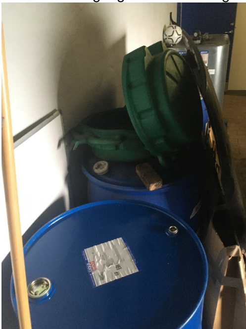
Opbevaring af affald af køler væske i plastiktromle uden spildsikring

Køler væske kildesorteres i egnet beholder (se affaldsskema). Beholderne er placeret i garagen (bygning 2) på ikke-tæt betonstensbelægning. Under belægningen findes helstøbt betongulv. Der er ingen afløb til kloak, men oplaget sker uden spildopsamlingsmulighed. Beholderne er placeret tæt ved port med adgang til det fri. Belægning udenfor porten består af ikke-tæt betonstensbelægning.