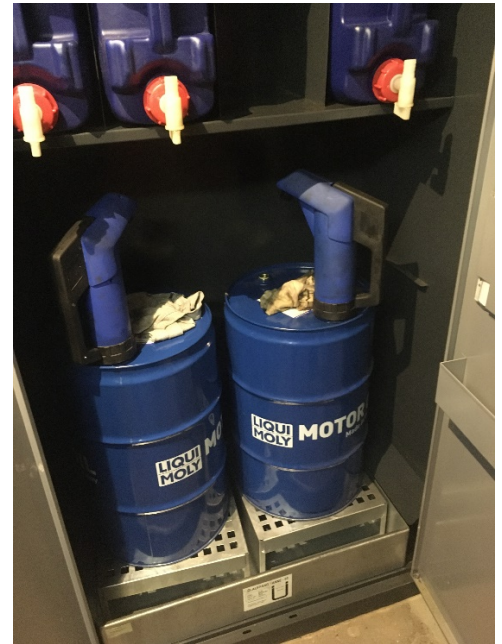
Kemikalieopbevaring i miljøskab med spildsikring.