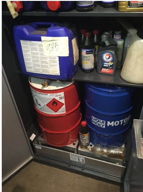
Kemikalieopbevaring i miljøskab med spildsikring.