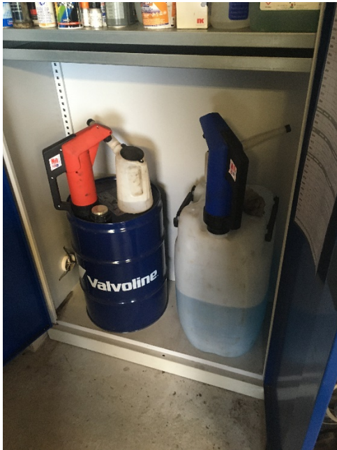
Kemikalieopbevaring i miljøskab uden spildsikring.