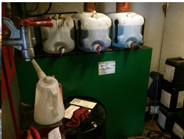
Lovlig opbevaring på tæt betongulv uden afløb eller med afløb til lukket sump.