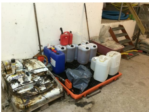
Lovlig opbevaring på spildbakke.