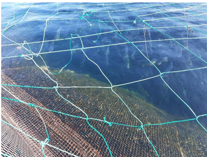
Figur 2 – Regnbueørreder i Musholm Vest havbrug

Yngel vaccineres på dambrug inden de modtages på havbruget. Yngel modtages fra brøndbåd, hvor de tælles ved udsætningen ved hjælp af laser. Eksempel på turrapport blev fremvist. Vægt oplyses af dambruget.