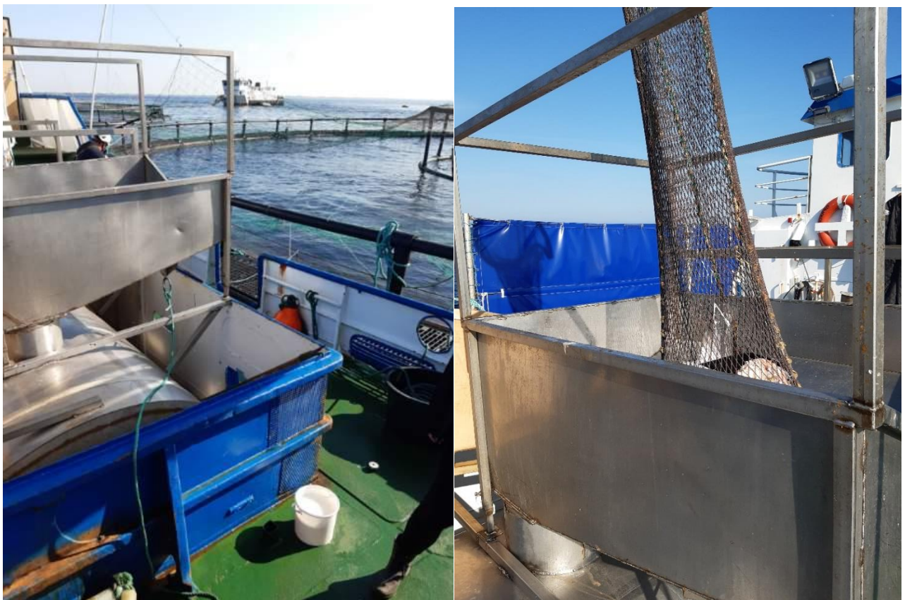
Figur 4 Døde fisk fra net lastes ombord på båd og opbevares i lukket container – Musholm Vest havbrug.

Musholm benytter sig af en båd, som fungerer forskelligt i sæsonen. I produktionsperioden benyttes båden til opbevaring og transport af døde fisk, og i høstperioden stunnnes og afblødes fisk ombord under transport til slagteri på havnen i Reersø.