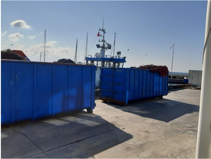
Figur 5 - containere med opbevaring af net før afsendelse til Hvide Sande vask, reparation og evt. imprægnering