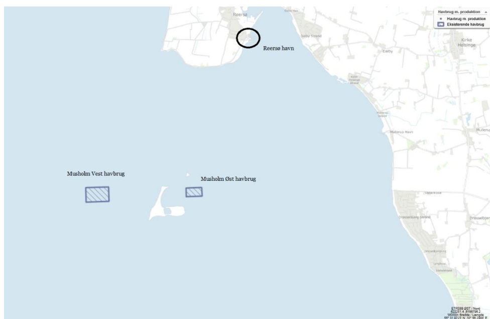
Figur 1 - Musholm Vest havbrug og Musholm Øst havbrugs lokalitet