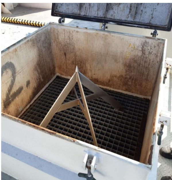
Figur 3 - skær på dækket, som åbner bigbags med foder. Fodersilo befinder sig neden for gitteret.

Havbruget modtager foder via båd, hvilket betyder at foderet ikke opbevares på havnen. Foderbåden afleverer den ønskede mængde foder i 1 tons lukkede bigbags, som med kran løftes op på foderflåden og sænkes ned på et skær, der sprætter sækken op i bunden således at foderet fyldes ned i fodersiloerne på foderflåden, se figur 3. Høje sider omkring siloernes skær sikrer imod spild. Fodring sker igennem et rørsystem, som via en computer bliver styret således fodringen tilpasses den biomasse, der befinder sig i nettene. Antal døde fisk fjernet modregnes i styringsprogrammet således fodring justeres derefter. Fodringen overvåges fysisk og digitalt af en fodermester, som ved observeret ændret ædelyst kan reducere fodermængden. Fodermesteren kan desuden stoppe eller reducere fodringen hvis det er nødvendigt. I eksempelvis varme perioder stoppes fodringen helt. Ved tilsynet blev fodringsdata, hvor bl.a. dagens mængde brugt foder og udregnede foderkvote fremgår fremvist. Varedeklaration på en foderleverance blev fremvist.