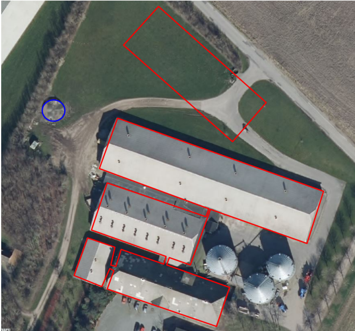
Figur 2: Indtegning af stalde og fortank i revurderingsskema 223626.

Staldenes produktionsarealer er herved løseligt fastlagt som følger: