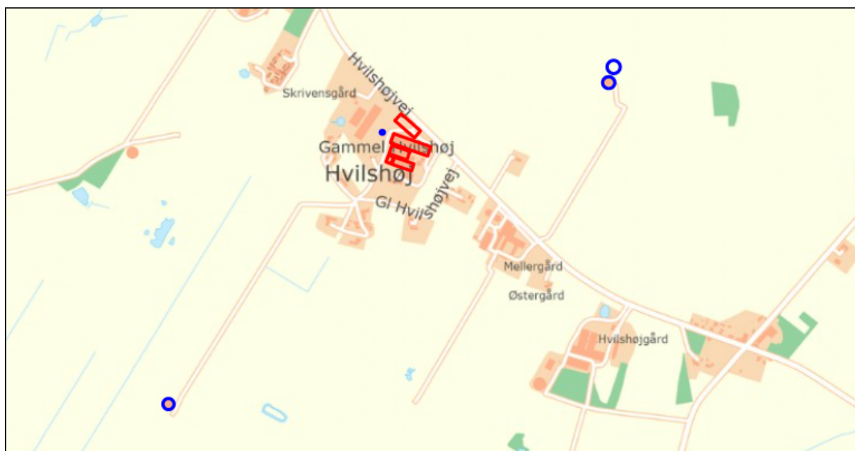
Figur 1: Indtegning af stalde og gylletanke i revurderingsskema 223626. Stalde er vist med rød streg, gylletanke med blå.

I revurderingen skal fordampningen af ammoniak beregnes ud fra produktionsarealet, dvs. det samlede stiareal i samtlige bygninger, samt overfladen af gylletankene. Du har indsendt en tegning over bygningernes indretning med de forskellige stalde, og ud fra denne er hver staldtype målt op i luftfoto med det pågældende produktionsareal for hver gulvtype. For den nye stald, som endnu ikke er bygget, er der taget udgangspunkt i, at der er ansøgt om en stald på 24*75 meter. Indtegningen af stalde og gylletanke kan ses i figur 1 og 2.