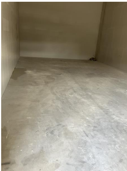
Ny tilbygning, 2023

Virksomheden har etableret en ny tilbygning, som knap er færdig. Bygningen skal bruges til lager og er med betongulv uden afløb.