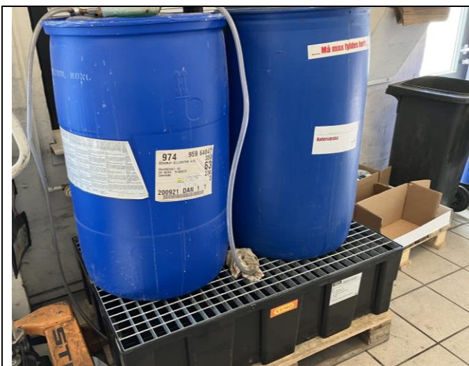
Ny spildebakke til farligt affald/kemikalier, 2023