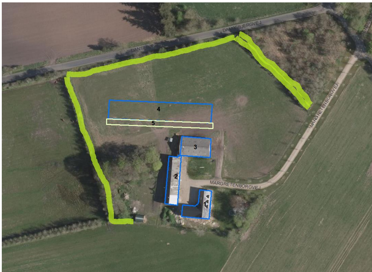
Figur 4. Beplantning som skal bevares og vedligeholdes er markeret med lys grøn.

Ejendommen virker ikke dominerende i landskabet i dag. Det er Vejen Kommunes vurdering, at den forholdsvis anonyme fremtoning og minimale landskabelige påvirkning ejendommen har og yder i dag, kan bevares ved, at den beplantning, der er ved ejendommen i dag, bevares og vedligeholdes. Der stilles vilkår herom.