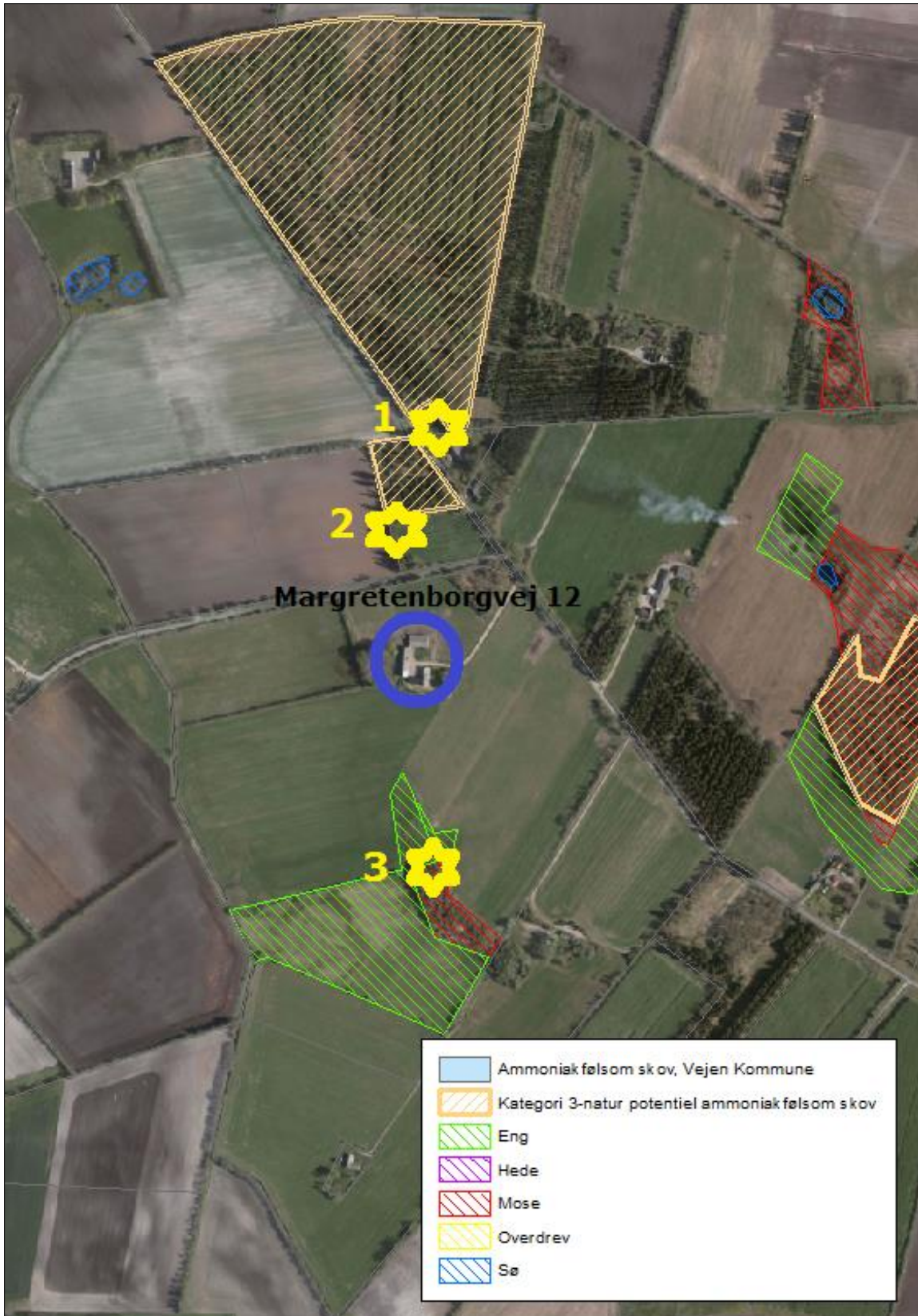
Figur 3. Kort over kategori 3 natur ved anlægget.