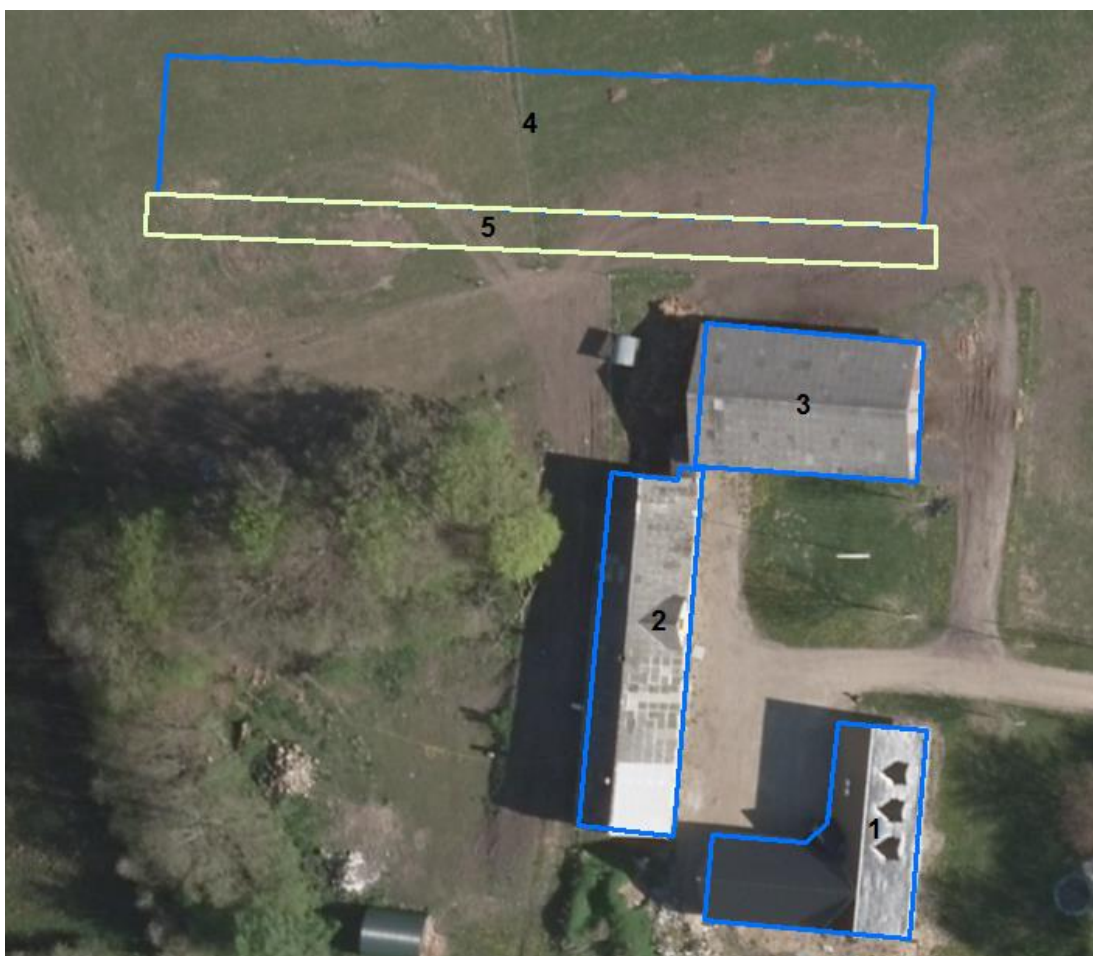
Figur 1. Husdyrbrugets driftsbygninger.

Højde og bredde på den nye bygning vil være identisk med den bygning, som den placeres parallelt med.