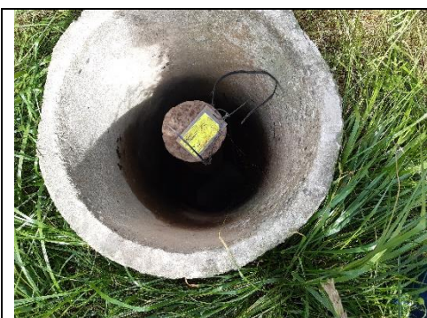
Fig. 3 Boring DGU nr. 59.267

De to monitoringsboringer DGU nr. 59.267 og 59.359 er begge forsynet med en ydre beskyttelsesring uden om forerøret. Både ydre beskyttelsesring og forerør er forsynet med dæksel/låg men ikke med lås, hvilket er et krav i boringsbekendtgørelsen. Boringer bør forsynes med entydig mærkning til identifikation, fx DGU nr. Det er kommunen som er myndighed i forhold til godkendelse og tilsyn med boringer, jf. brøndborerbekendtgørelsen 1 , – derfor sendes boringsnotat og tilsynsnotat til kommunen til orientering.