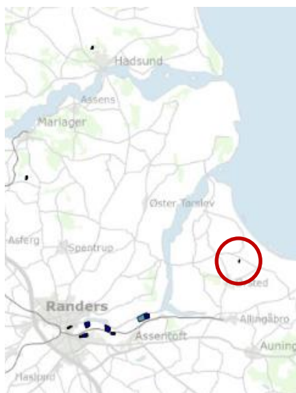
Fig. 1 Bendsvej Losseplads