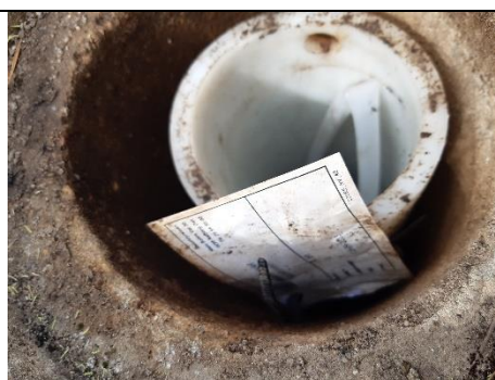
Fig. 4 Boring DGU nr. 59.359