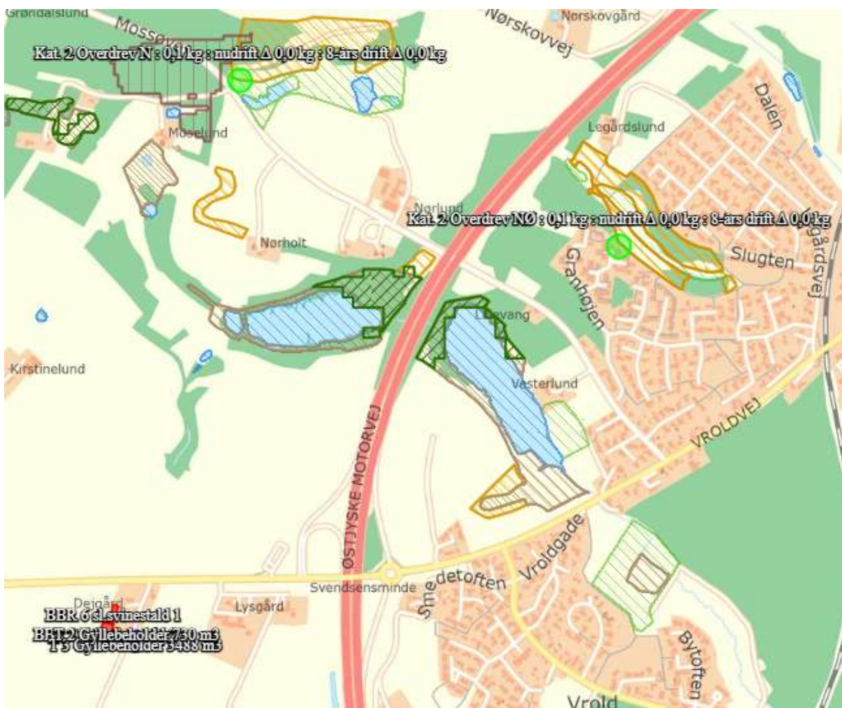
Figur 2-3 Beregning af deposition til kategori 2 natur

Overdrevene er på den baggrund ikke beskrevet nærmere.