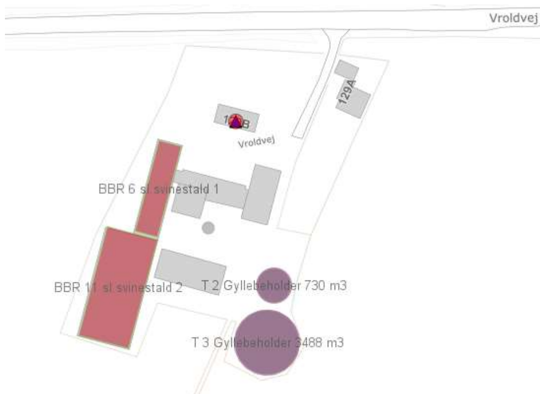
Figur 2-1 Oversigtstegning, stalde og gødningslagre

Der søges om miljøgodkendelse til et eksisterende anlæg, som på nuværende tidspunkt har en miljøgodkendelse fra 2006. I hele perioden har der været gyllekøling i den største af staldene BBR11 (se figur 2-1), og det vil der fortsat være.