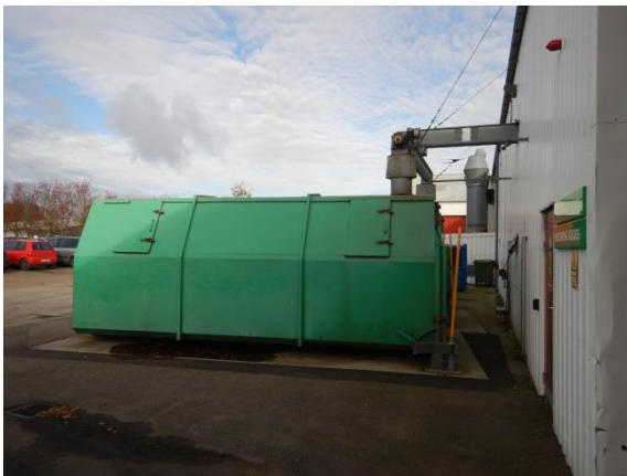
3. Container til støv fra afrensning.