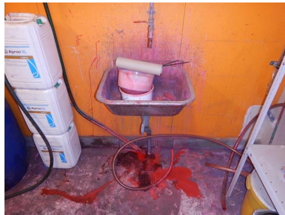
4. Vask og afløb til farligt affald – løber til nedgravet tank.