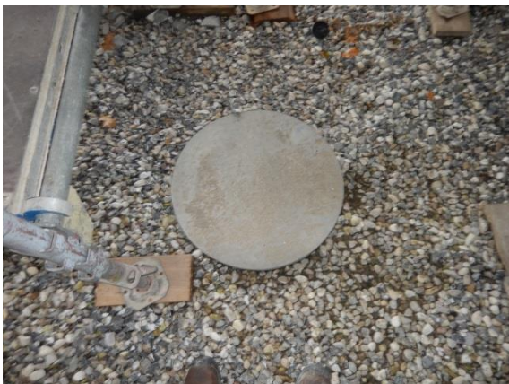
5. Dæksel til nedgravet tank med farligt affald.