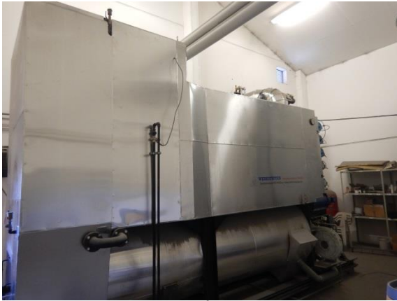
1. Biomassefyr på 500 kW.