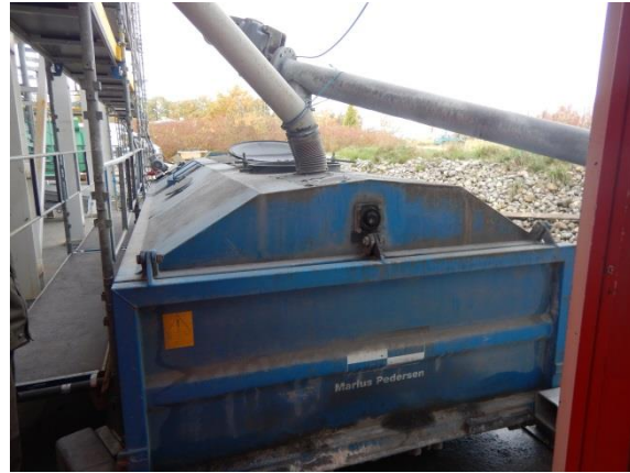
2. Container til aske fra biomassefyr.