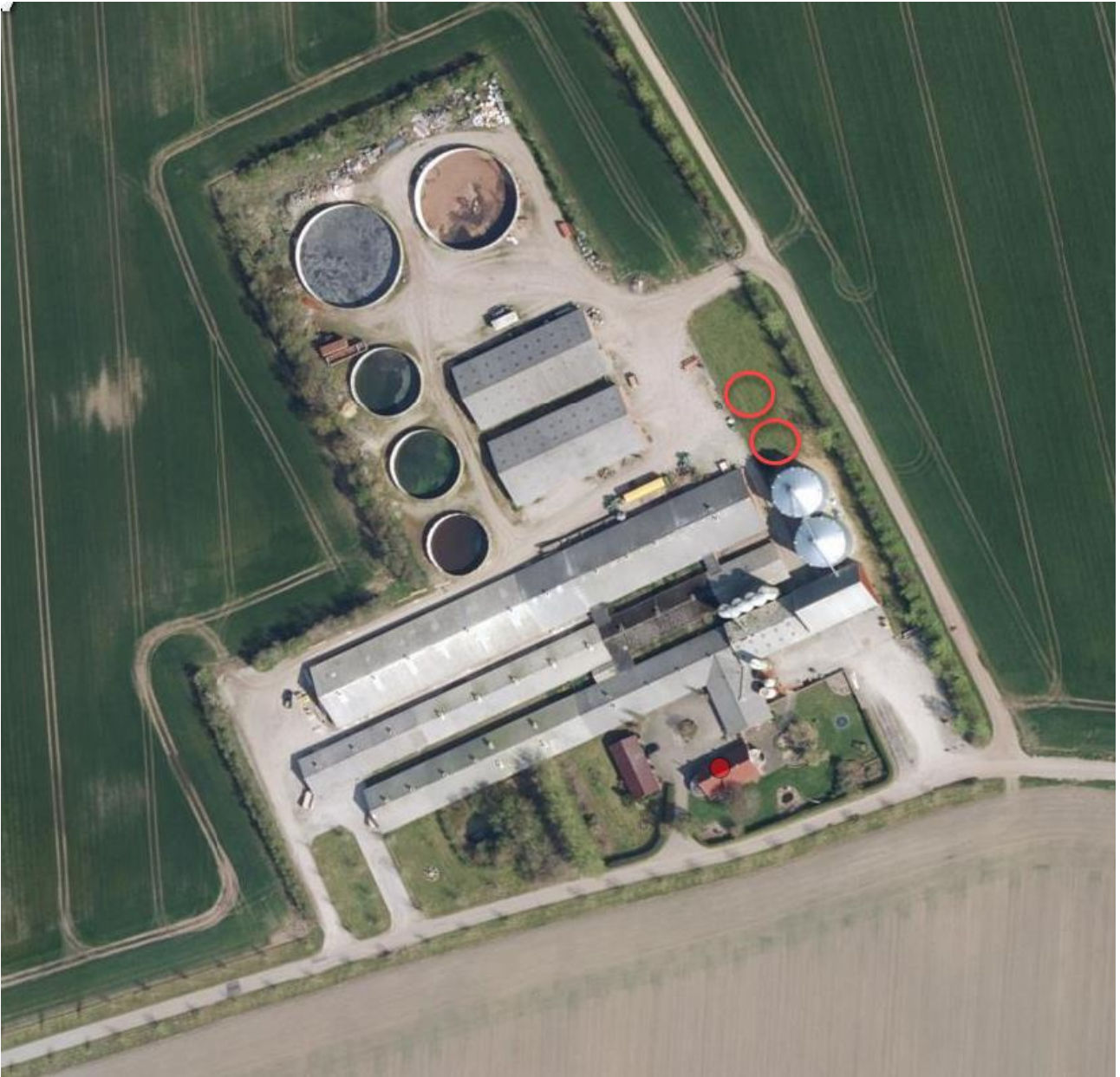
De røde cirkler markerer placeringen af de to ansøgte siloer