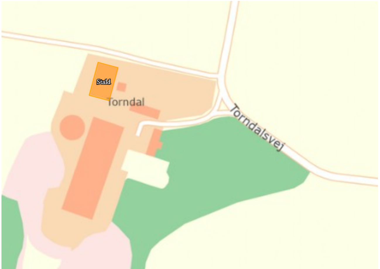
Bilag 3: Situationsplan (uddrag fra husdyrgodkendelse.dk skema nr. 222627.