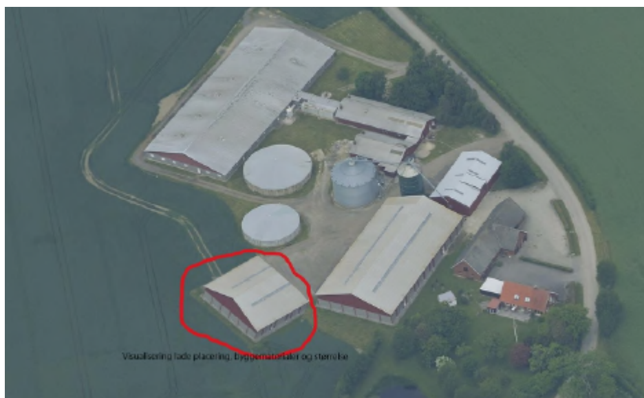
Luftfoto fra anmeldelsen

Lolland Kommune har via www.husdyrgodkendelse.dk modtaget anmeldelse efter husdyrgodkendelsesbekendtgørelsen 1 (HGB) § 10, stk. 1 om etablering af en lade til egne afgrøder på ejendommen Storemosevej 115, 4944 Fejø (CVR nr. 26773989). Anmeldelsen er suppleret med en nærmere beskrivelse af det anmeldte (bilag til denne afgørelse).