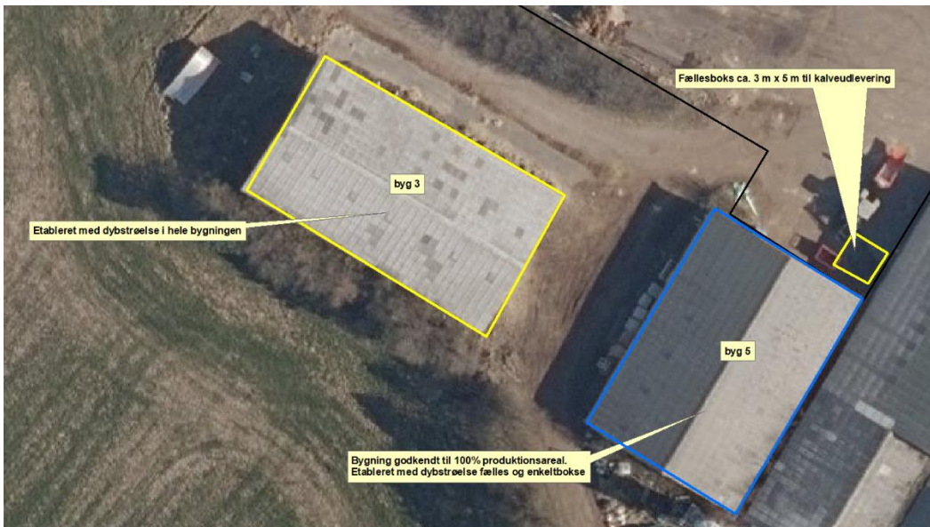
Figur 1. Bygninger hvor der sker ændringer af produktionsarealet. I bygninger indtegnet med gul øges produktionsarealet, i bygning indtegnet med blå reduceres det.