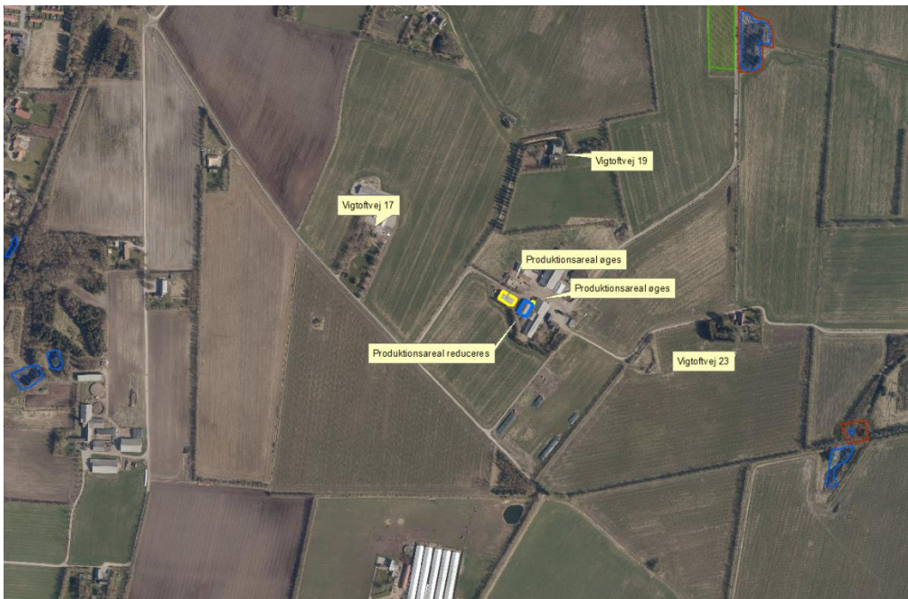
Figur 4. Placering af ændringen i forhold til nabo og natur.

Varde Kommune vurderer, at ændringen ikke vil påvirke naboerne negativt. Produktionsarealet forøges ikke som følge af ændringen. Dermed forøges lugtafgivelsen heller ikke. Der er ikke nabobeboelser indenfor 230 m, se figur 4.