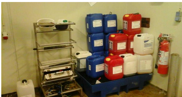
Oplag af rengøringsmiddel

Virksomheden anvender ca. 120 t eddikesyre om året. Eddikesyren oplagres i en dobbeltvægget tank på 40 m 3 der er placeret udendørs mod syd. Tanken er udstyret med alarm.