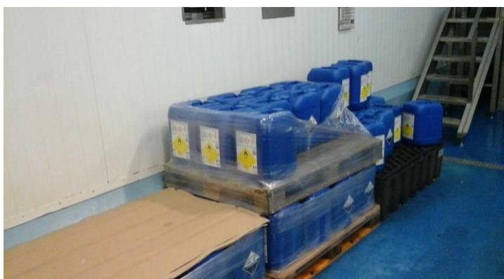
Oplag af brintoverilte