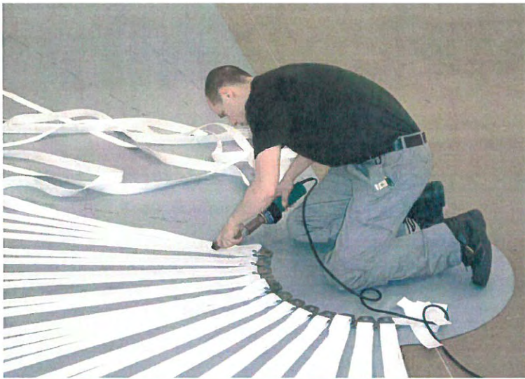
Produktion af Agro-Top overdækning