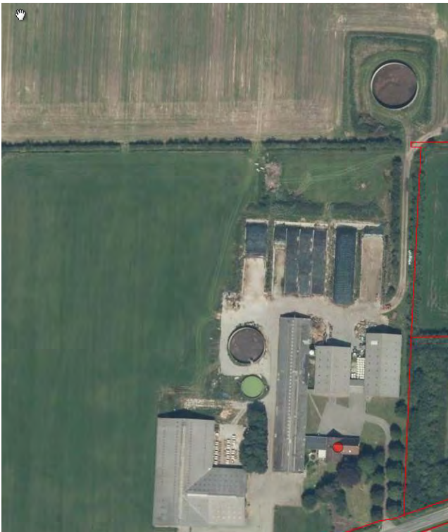
Figur 1. Beliggenhed af de 2 gyllebeholdere. Der er søgt om overdækning af de 2 nordligste.

Du har indsendt en ansøgning gennem husdyrgodkendelse.dk, da du ønsker at overdække 2 af dine gyllebeholdere. Der er tale om de 2 nordligste beholdere. Desuden har du indsendt en beskrivelse af teltoverdækningerne, se bilag 1.