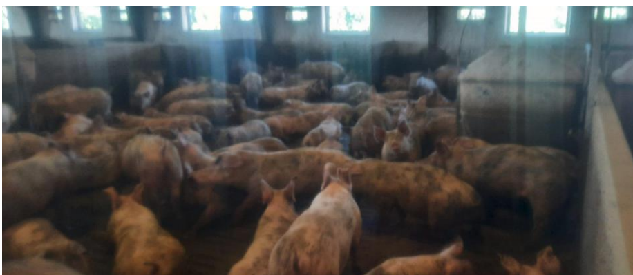
Figur 4. Grise i stald 7(19) den 15-8-22.

Den 15-8-22 besøgte Susanne Seested og Klaudi Andresen fra Varde Kommune Kirkebjergvej 28. Ved besøget blev det konstateret, at grisene i stald 7(19) og stald 1(16), der er beskrevet i miljøgodkendelsen fra den 18. maj 2021, var meget beskidte. Se figur 4 og 5.