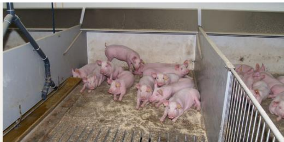
Figur 2. Stald med åben stiedskillelse i gødearealet. Kun hvor anden stiedskillelse har å