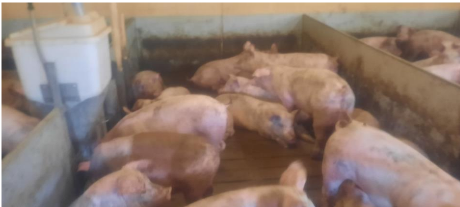
Figur 6. Grise i stald 5(11) den 15-8-22.

Figur 6 og 7 viser billeder af grise i stald 5(11) og 3(8), der er beskrevet i miljøgodkendelsen fra den 18. maj 2021. Disse stier er mere korrekt indrettet til slagtesvin. Og grisene i stald 5(11) og 3(8) var den 15-8-22 ikke nær så beskidte som i stald 7(19) og stald 1(16).