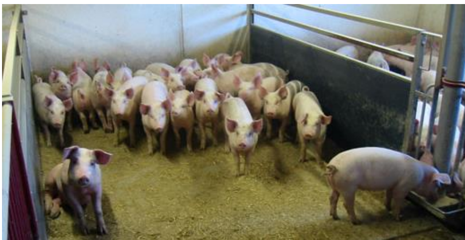
Figur 1. Slagtesvinesti.

For at reducere svineri skal lejeområdet være i den ene ende og spaltearealet skal være i den anden ende. Derudover skal inventaret være åbent i den ende, hvor der er spalter. Overbrusningsanlægget skal også være i den ende, hvor der er spalter. Ved at indrette stien på denne måde reduceres svineri i stierne betydeligt.