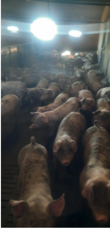
Figur 5. Grise i stald 1(6) den 15-8-22.

Figur 6 og 7 viser billeder af grise i stald 5(11) og 3(8), der er beskrevet i miljøgodkendelsen fra den 18. maj 2021. Disse stier er mere korrekt indrettet til slagtesvin. Og grisene i stald 5(11) og 3(8) var den 15-8-22 ikke nær så beskidte som i stald 7(19) og stald 1(16).