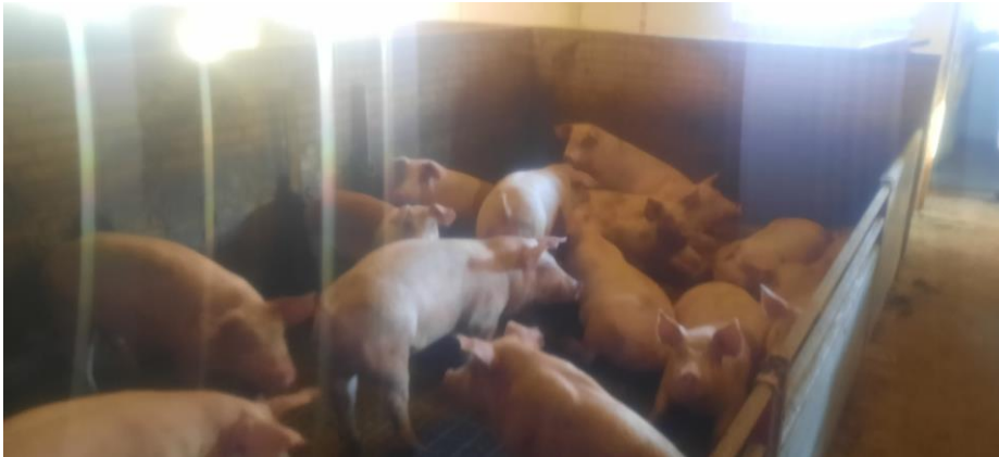
Figur 7. Grise i stald 3(8) den 15-8-22.

En slagtesvineproduktion kræver normalt en større ventilationskapacitet i forhold til søer og smågrise. I forbindelse med ændring af stalde fra søer til slagtesvin er ventilationen ikke blevet tilpasset en slagtesvineproduktion. Det har bevirket at ventilationen ikke har været optimal, hvilket har medført mere svineri i stierne.