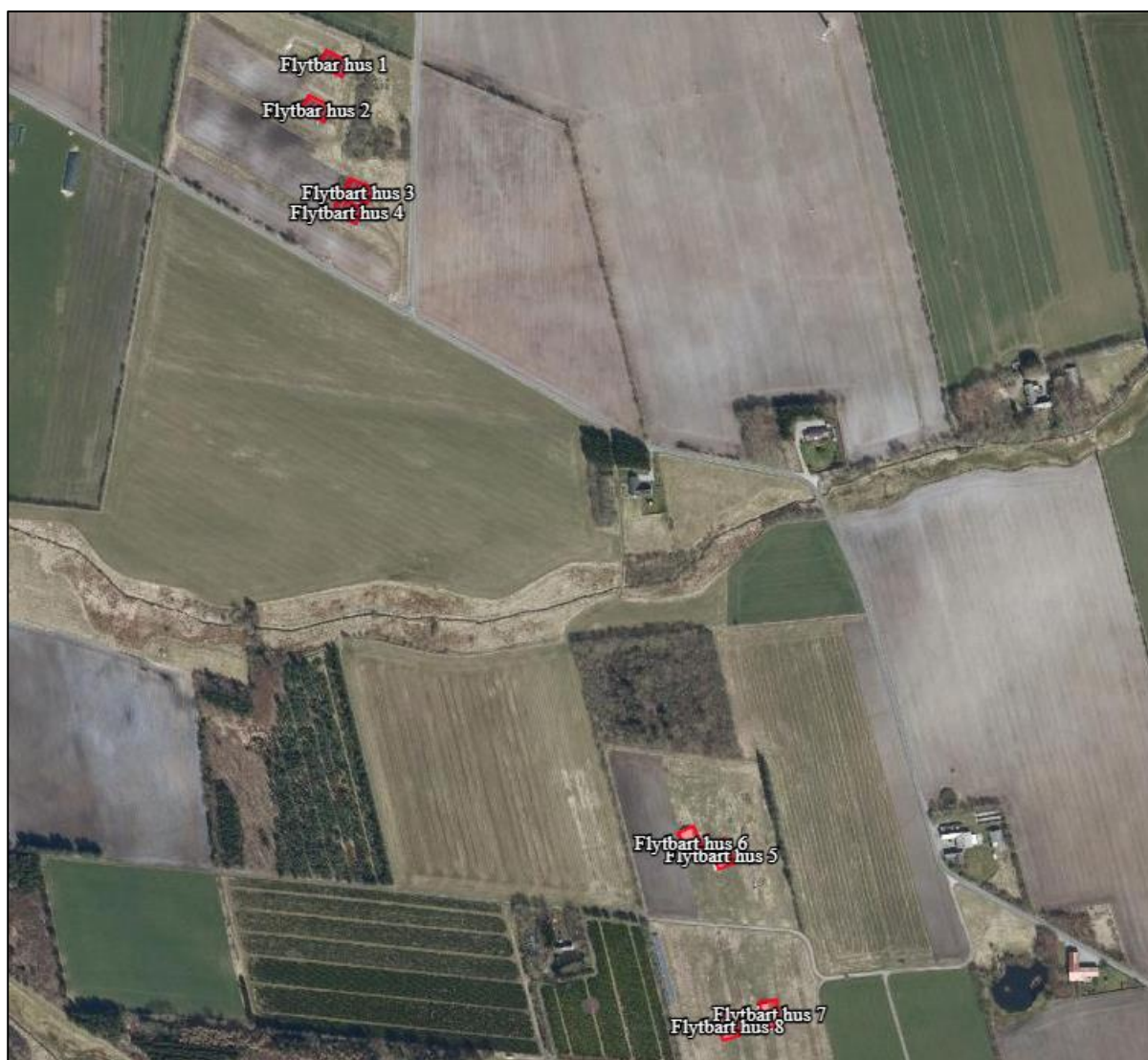
Figur 1. Husdyrbrugets driftsbygninger.

Tabel og figur herunder viser den fremtidige bygningsanvendelse på ejendommen.