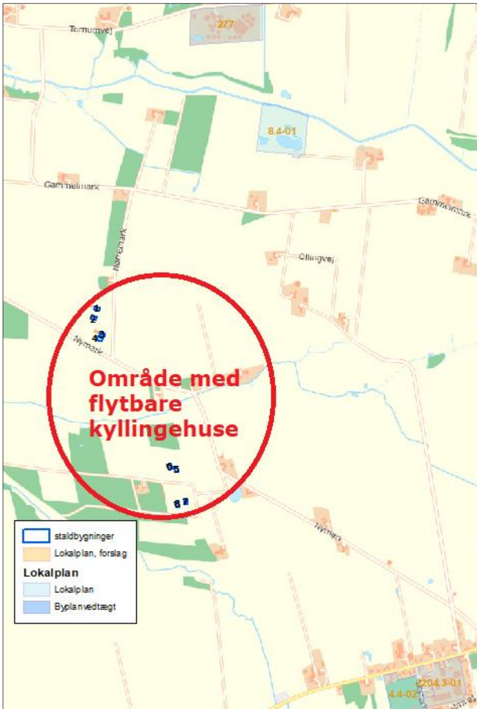
Figur 3. Husdyrbrugets placering.