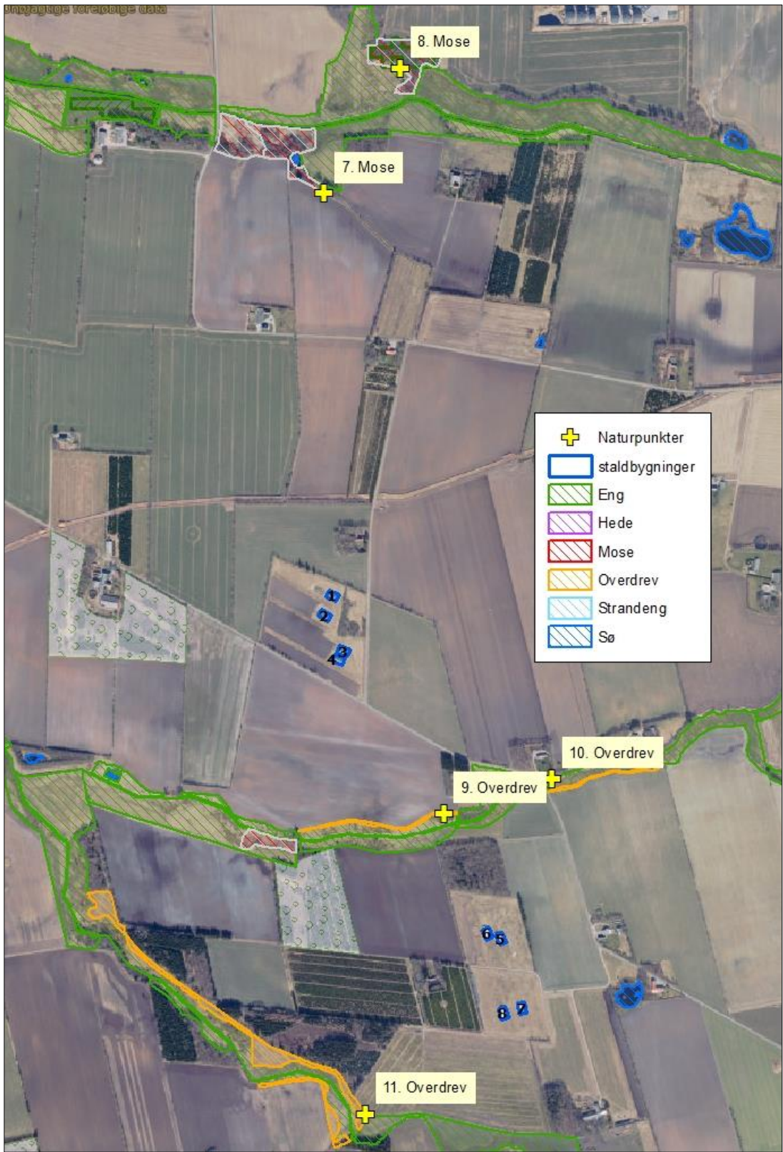
Figur 4. Kort over kategori 3 samt § 3 natur ved anlægget.