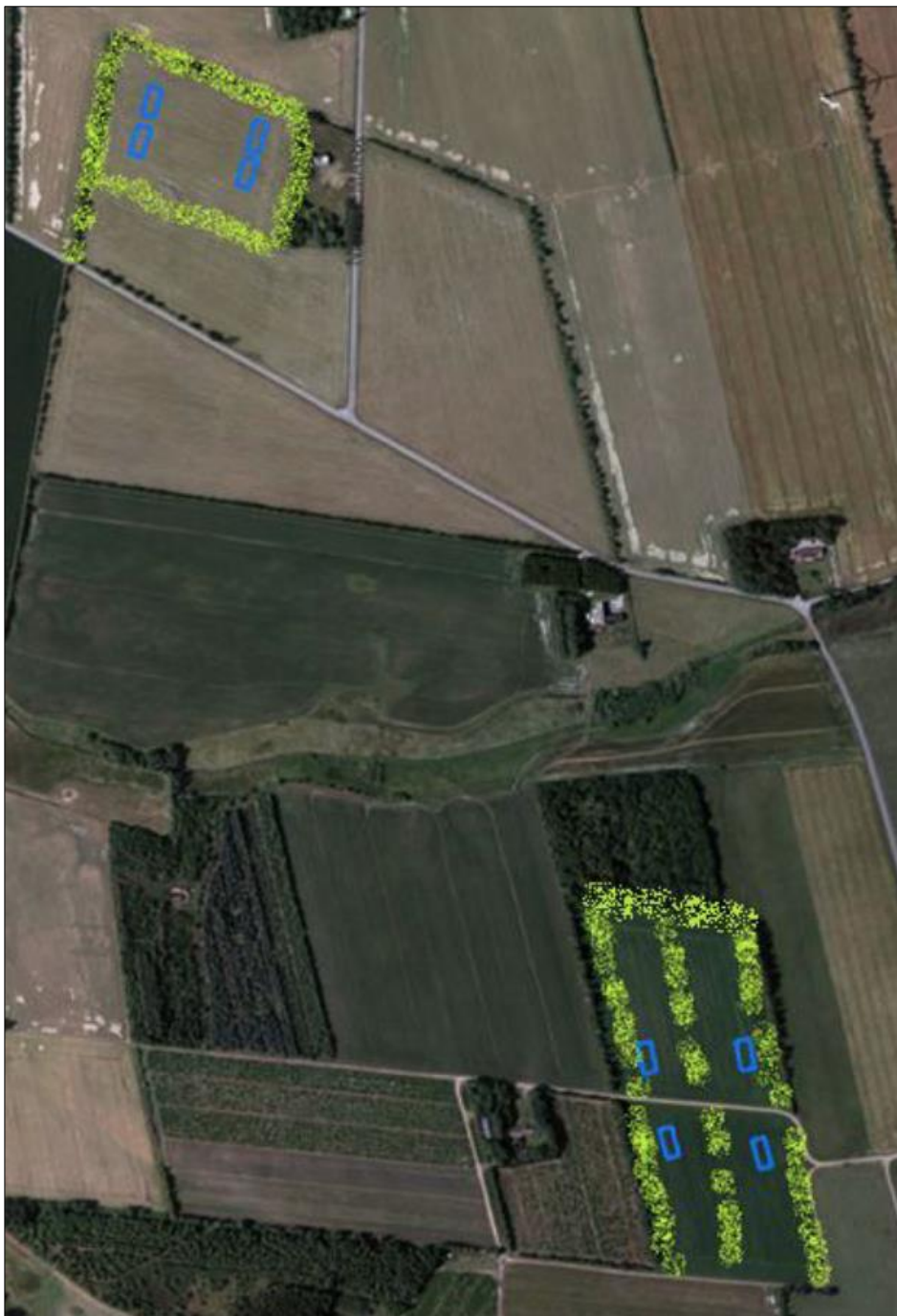
Figur 2. Skitse over læhegn som skal etableres og vedligeholdes på matr. nr. 729, 732 og 734, alle Hygum, Sdr. Hygum.

Vejen Kommune stiller vilkår om etablering og vedligehold af nyt og eksisterende læhegn ved kyllingehusene – se figur 2.