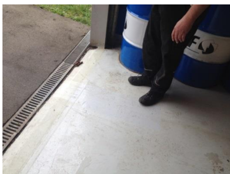
Afløb til regnvand udenfor port i kælder

Olie opbevares uden risiko for påkørsel.