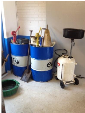
Olieprodukter i kælder ved værkstedsbord ca. 10 meter fra portåbning