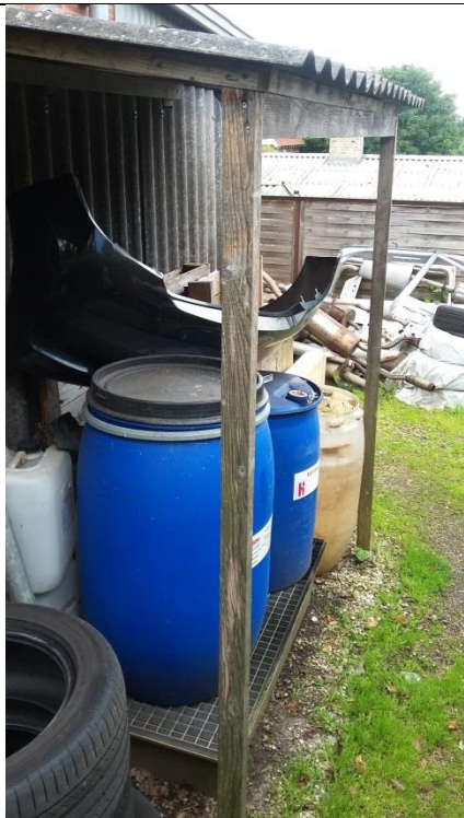
Figur 1. Opbevaring af olieholdigt metalskrrot sker på opsamlingsbakke

Olievædede klude bortskaffes sammen med oliefilter.