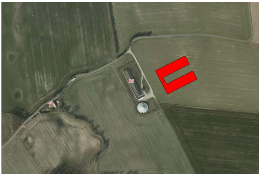
Figur 2: Nærmeste naboer til staldanlægget på matr. nr. 21, Langstedvej 63, 5690 Tommerup

Afstandskravet på 50 meter ifølge § 6, stk. 3 til byzone, sommerhusområder og lokalplaner er dermed overholdt.