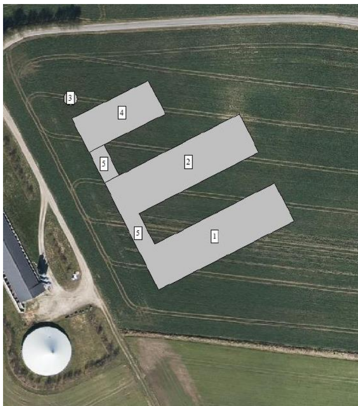
Figur 1: Anlægsoversigt: nr. 1 og 2 er svinestald, nr. 3 er fortank, nr. 4 er foderlade og nr. 5 er mellemgang.

Der er søgt om en årsproduktion på 13.000 smågrise (15–31 kg) og 8.000 slagtesvin (31-110 kg) svarende til 257,7 dyreenheder (DE).