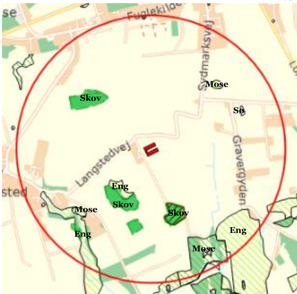
Figur 4: Oversigt over beskyttede § 3 naturområder (skraveret) og skove (grønne og grøn-skraveret) ifølge Kommuneplanen inden for 1.000 meter af staldanlægget på Holmegård.

Det naturområde der ligger tættest på staldanlægget er skovstykket (fredskov) syd/vest for. Skovstykket får ifølge beregningen i husdyrgodkendelse.dk en merdeposition på 0,8 kg N pr. ha pr. år og overholder dermed kravet til kategori 3-natur på 1,0 kg N pr. ha pr. år i merdeposition.