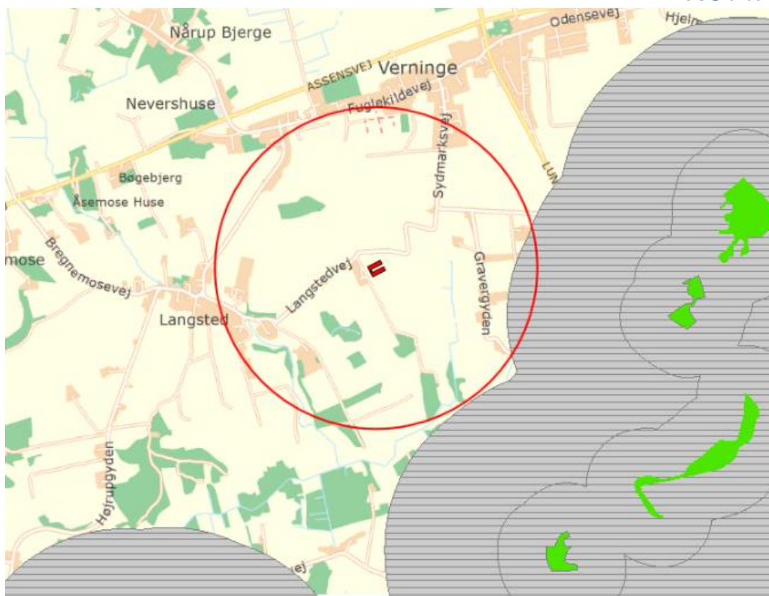
Figur 3: Holmegårds staldanlægs placering i forhold til § 7 naturområder (her vist med de tidligere bufferzoner) – den røde cirkel angiver 1.000 meter grænsen fra staldanlægget.