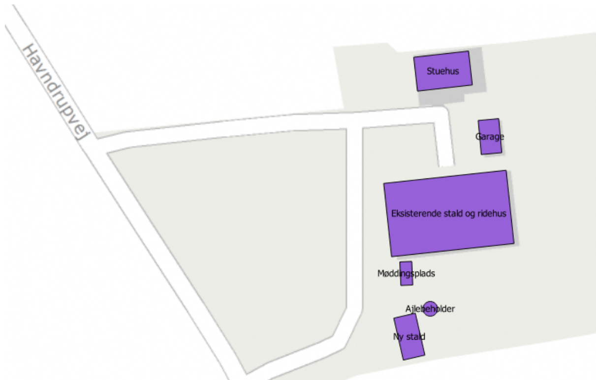
Figur 1. Oversigt over ejendommen