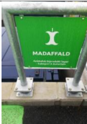
Skiltning ved rampen på omlastepladsen

Det blev oplyst, at der er planer om at indkøbe nye containere, med en anden lågkonstruktion, således at det lille låg, der åbner ind over rampenkanten, vil kunne komme længere ind under bilen ved aflæsning.