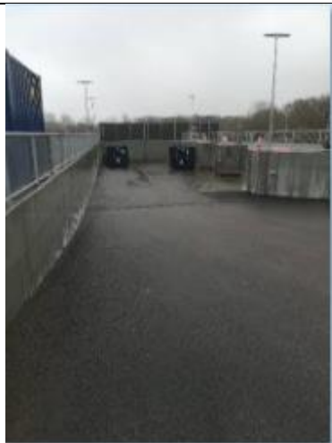
Foto ned i graven på omlastepladsen