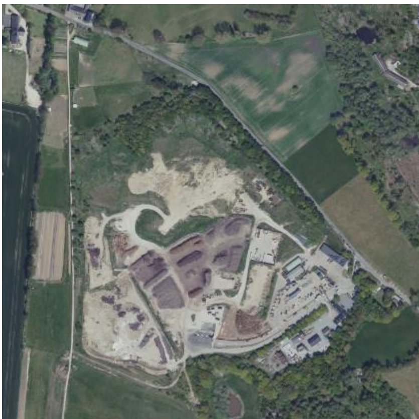
Oversigtskort over Skibstrup Affaldscenter