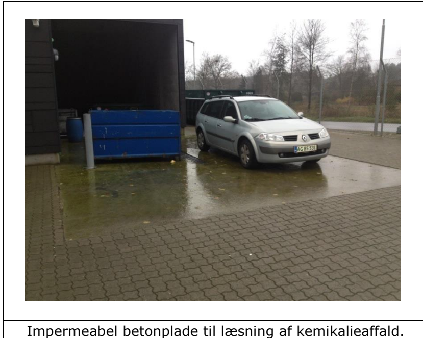
Impermeabel betonplade til læsning af kemikalieaffald.

Der er på virksomheden truffet de fornødne forholdsregler for beskyttelse af jord og grundvand.