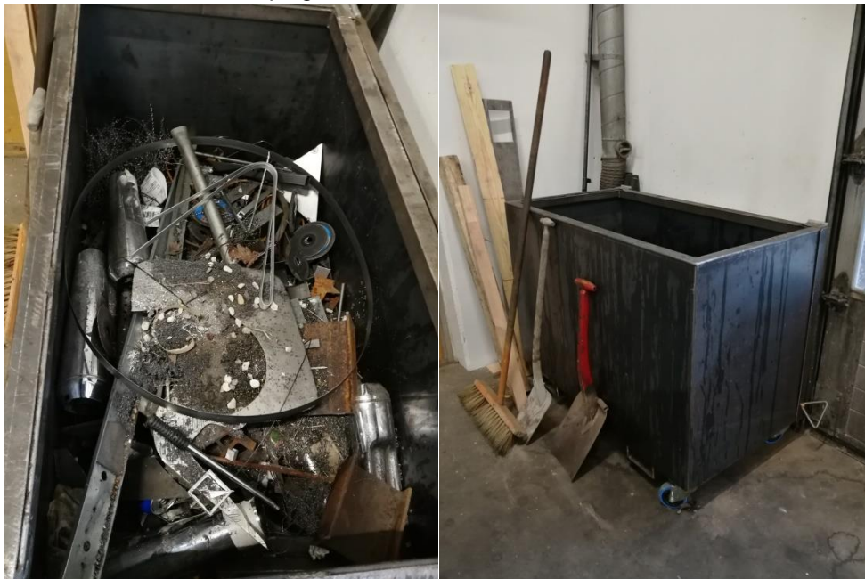
Billede 4 og 5: Container med metalaffald.

Virksomheden har intet oplag af affald udenfor.