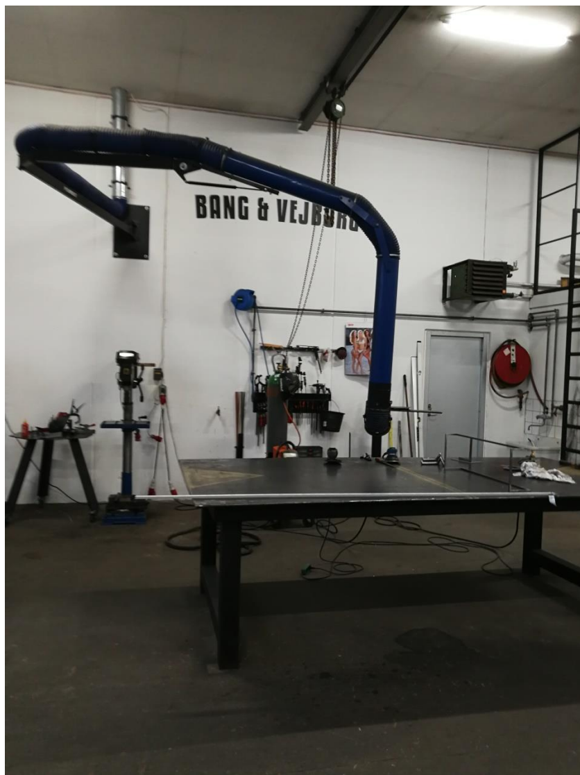
Billede 1: Svejsebord med udsugning