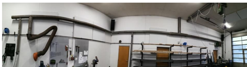
Billede 2: Samlet udsugningssystem for arbejdsbord og båndpudser