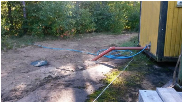
Billede 1 – nedgravet samletank