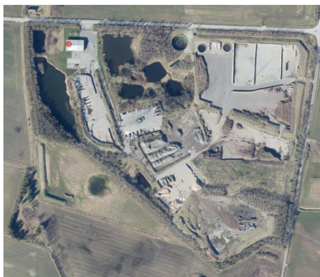
Billede 1. Luftfoto 2023.