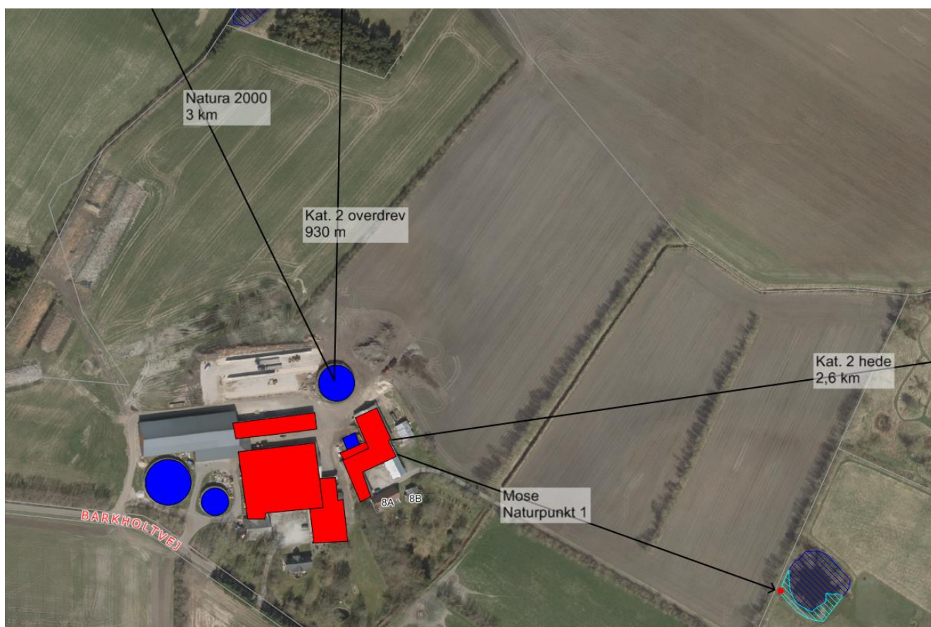
Figur 2: Husdyrbrugets beliggenhed i forhold til naturpunkter.