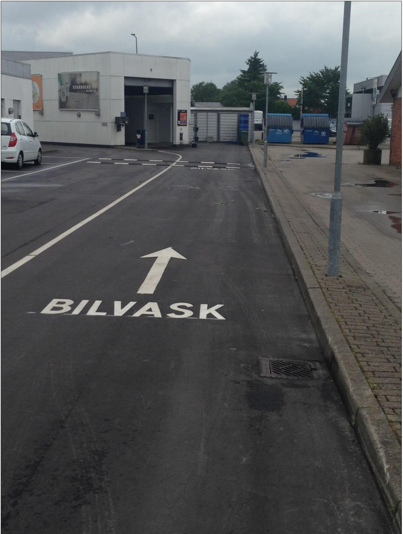
Indkørsel med to afløbsriste til regnvandsledningen i højre side af indkørslen.